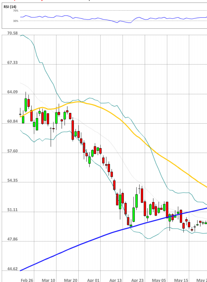
USD/RUB Daily Chart Current price: 51.96

На данный момент быки сохраняют значительное численное превосходство над медведями, занимая 71% всего рынка SWFX.