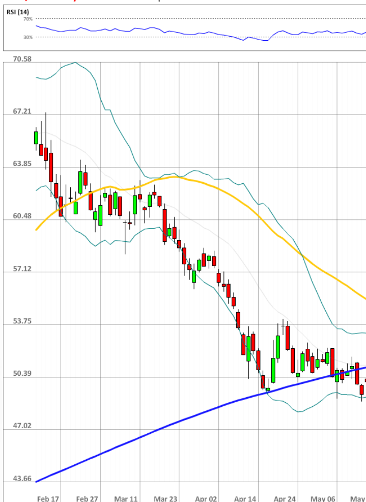
USD/RUB Daily Chart Current price: 49.05

Быки сохраняют значительное численное превосходство над медведями, занимая 75% от всего рынка SWFX, что на четыре процентных пункта выше уровня на утро понедельника.