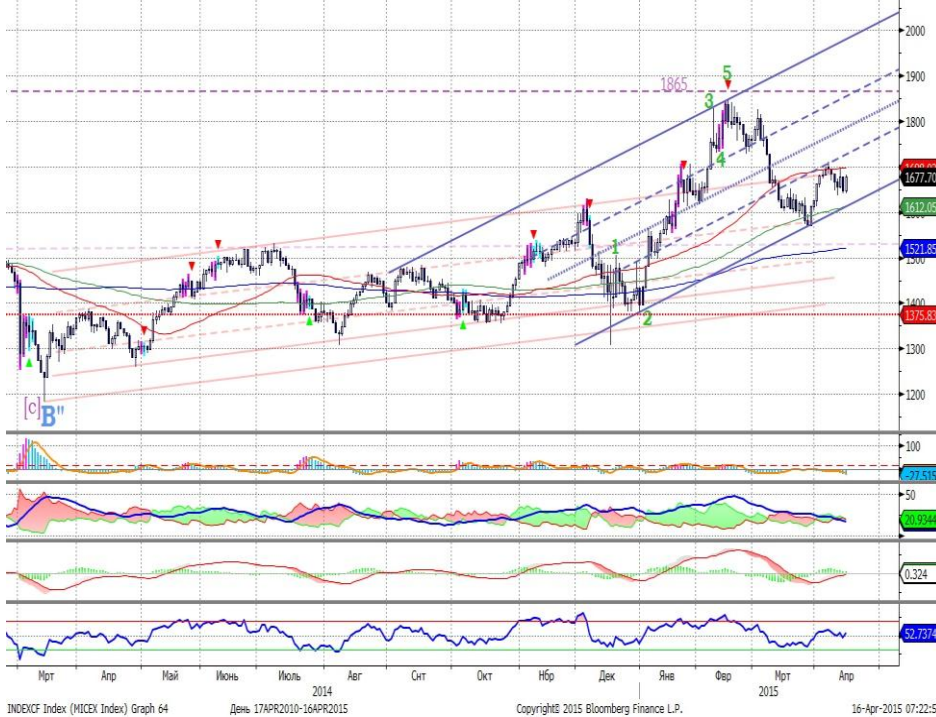
График 1. Дневная динамика Индекса ММВБ.

Индекс ММВБ – вблизи нижней границы восходящего канала.