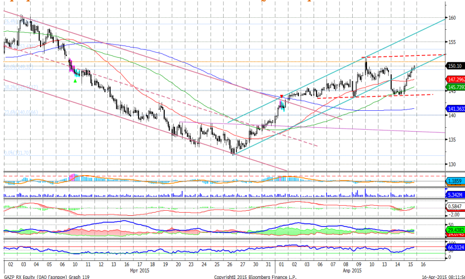
График 4. Часовая динамика стоимости акций Газпрома на ММВБ.