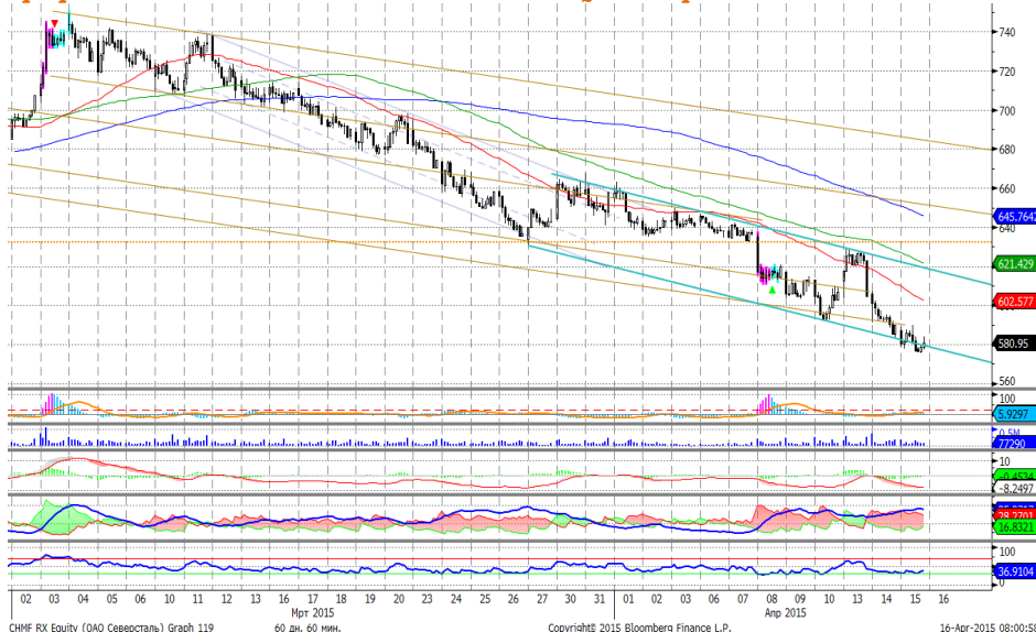
График 5. Часовая динамика стоимости акций Северстали на ММВБ.