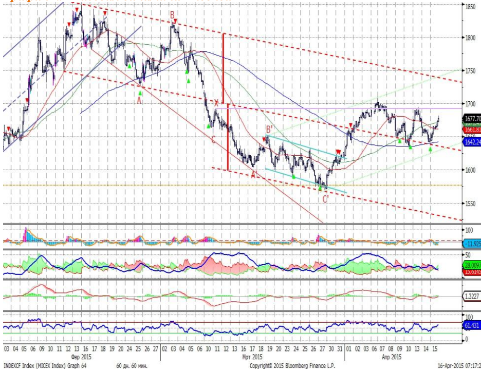
График 2. Часовая динамика Индекса ММВБ.

MACD сформировал сигнала к росту. DMI+ и DMI- сошлись, ADX в средней части шкалы и направлен вниз, что говорит об отсутствии тренда. Осциллятор RSI в средней части шкалы, сигналов нет. Индикатор, основанный на динамике ADX, в настоящее время выглядит нейтрально.