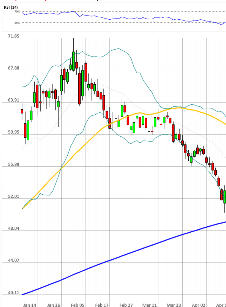
USD/RUB Daily Chart Current price: 50.84

Быки сохраняют значительное численное превосходство над медведями, занимая 73% от всего рынка SWFX (рост на 3 процентных пункта за последние 24 часа).