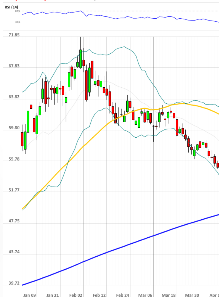
USD/RUB Daily Chart Current price: 51.83