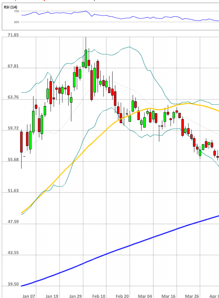
USD/RUB Daily Chart Current price: 54.96

Быки сохраняют значительное численное превосходство над медведями, занимая 74% от всего рынка SWFX, на 3 п.п. больше уровня на утро вторника.