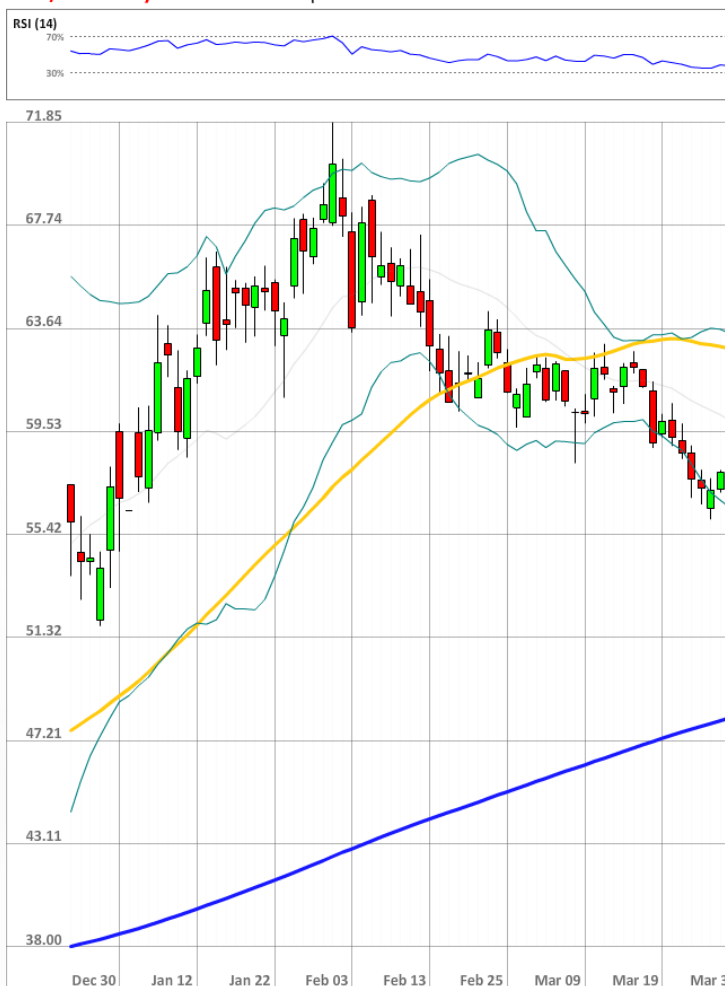
USD/RUB Daily Chart Current price: 58.16

Быки сохраняют значительное численное превосходство над медведями, занимая 73% от всего рынка SWFX, на 2 п.п. выше уровня на утро вторника.