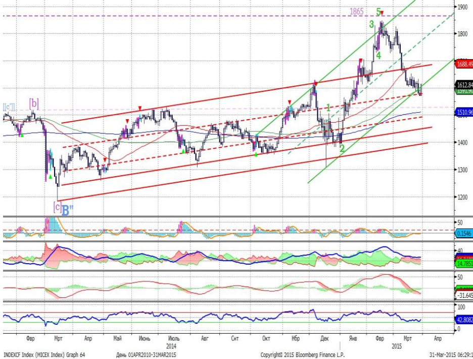
График 1. Дневная динамика Индекса ММВБ.

Северсталь: металлурги пользуются спросом