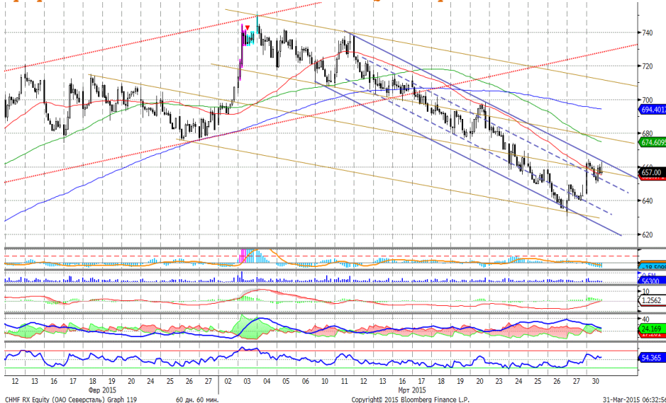
График 5. Часовая динамика стоимости акций Северстали на ММВБ.

Северсталь – поднялась к верхней границе нисходящего канала.