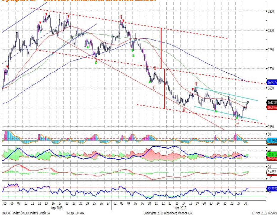
График 2. Часовая динамика Индекса ММВБ.

Индекс ММВБ – движется вверх в рамках нисходящего коридора значений.