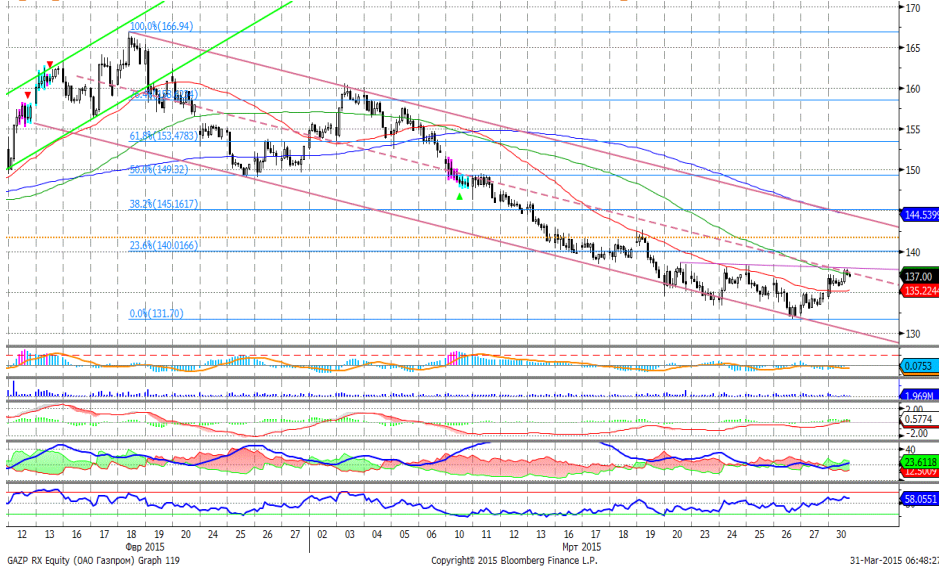
График 4. Часовая динамика стоимости акций Газпрома на ММВБ.

Газпром – оттолкнулся от нижней границы нисходящего ценового коридора.