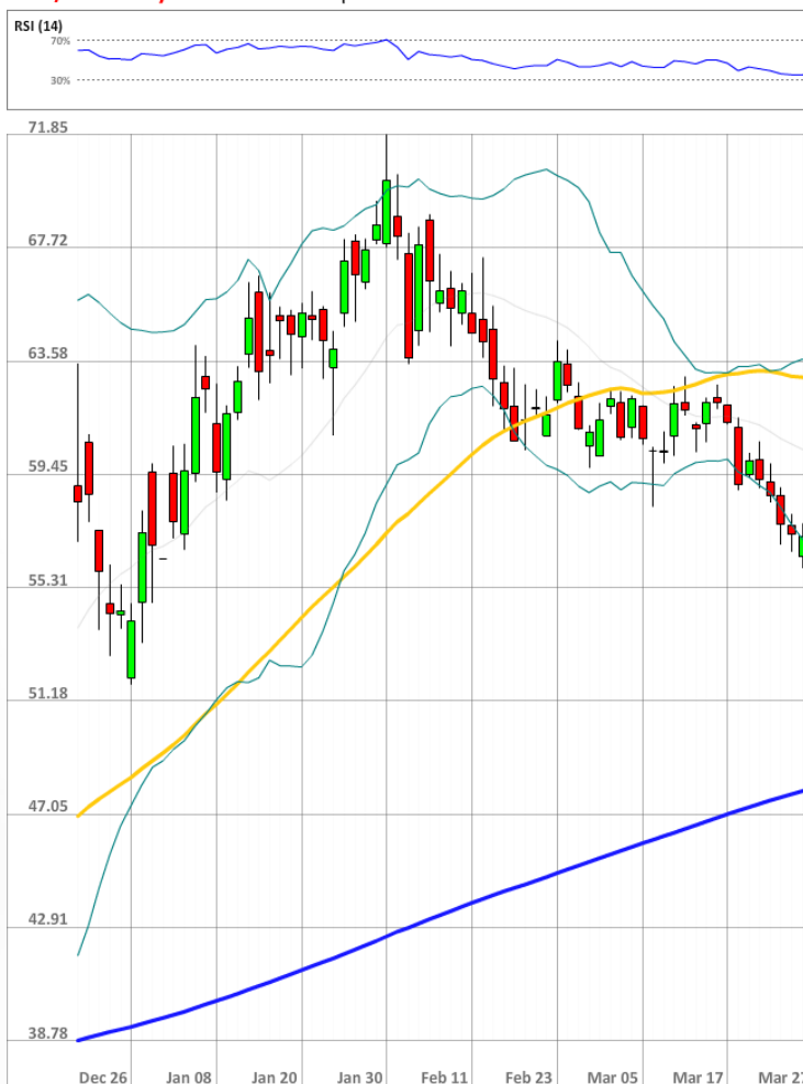
USD/RUB Daily Chart Current price: 57.88

Быки сохраняют значительное численное превосходство над медведями, занимая 71% от всего рынка SWFX, на 4 п.п. меньше уровня на утро пятницы.