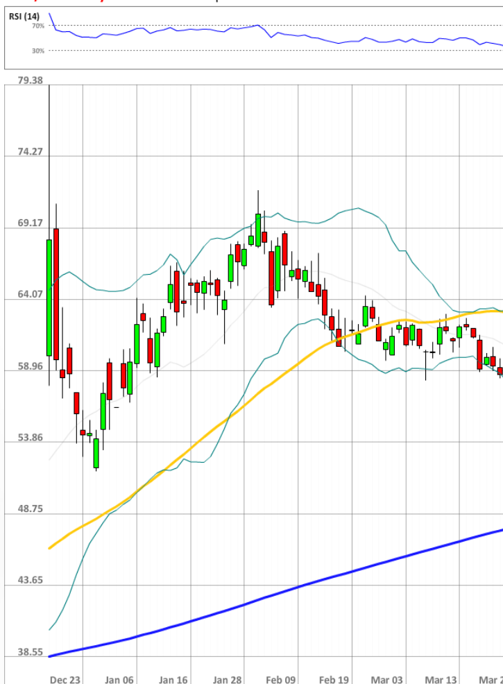
USD/RUB Daily Chart Current price: 57.26

Быки сохраняют значительное численное превосходство над медведями, занимая 75% от всего рынка SWFX, что на 4 п.п. выше уровня на утро среды.