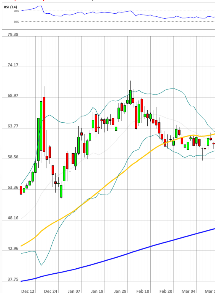
USD/RUB Daily Chart Current price: 62.08

Быки сохраняют значительное численное превосходство над медведями, занимая 75% от всего рынка SWFX, что на 4 п.п. больше значения понедельника.