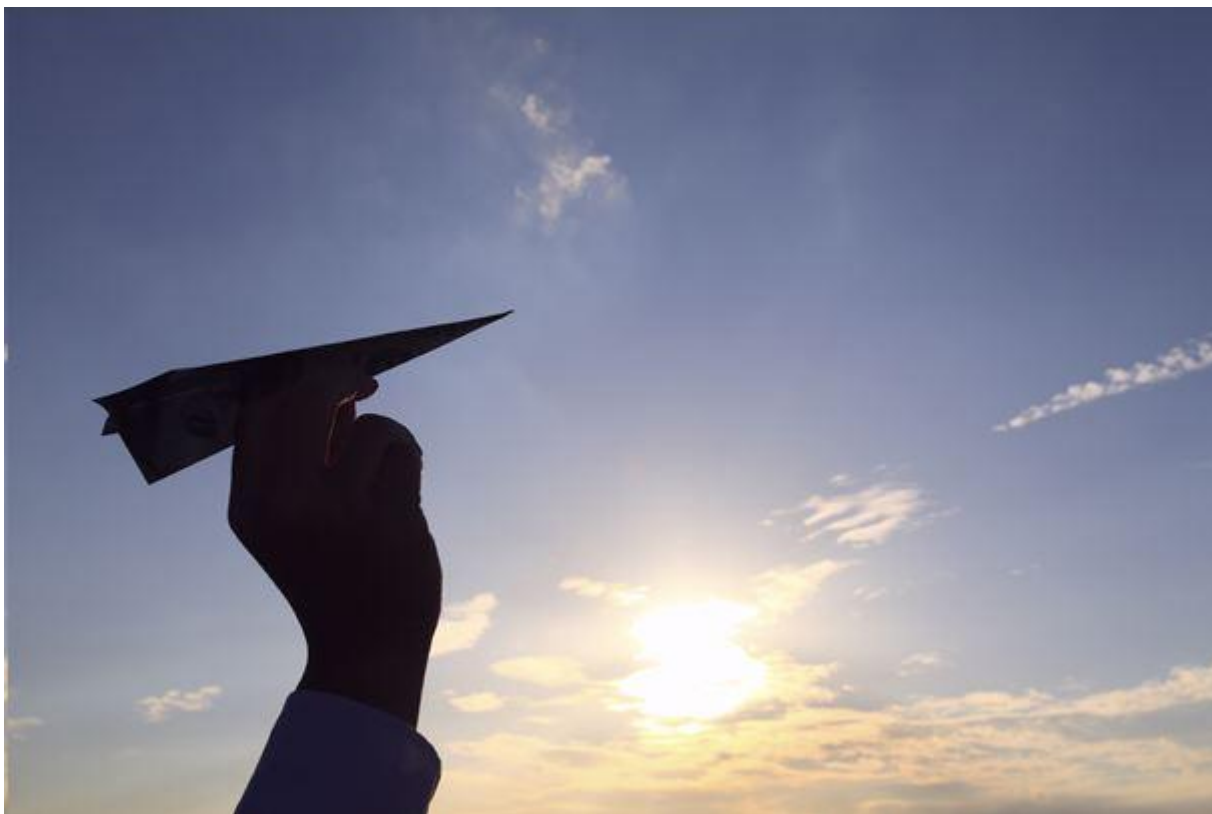
Порящий доллар оказал влияние на целый ряд сырьевых товаров.

Энергетический сектор сдал позиции в свете непрекращающегося увеличения запасов в США, а на рынке драгоценных металлов начало нарастать волнение в преддверии заседания Федерального комитета по операциям на открытом рынке, которое состоится на следующей неделе.