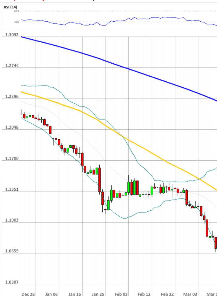
EUR/USD Daily Chart Current price: 1.0515

В четверг количество длинных позиций составило 49%, что на три процентных пункта ниже, чем 24 часа назад.