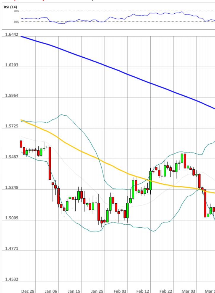
GBP/USD Daily Chart Current price: 1.4929

Среди трейдеров SWFX по-прежнему больше быков, так как 55% позиций являются длинными. В то же время доля ордеров, выставленных на покупку, выросла до 39%.