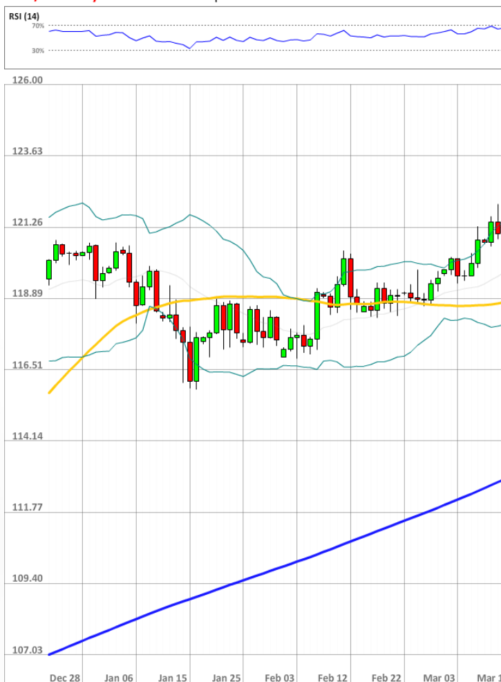
USD/JPY Daily Chart Current price: 121.46

Третий день подряд настроение рынка не меняется - доля длинных позиций остаётся на уровне 55%. Однако число ордеров, выставленных на покупку доллара США, немного упало: с 67 до 65%.