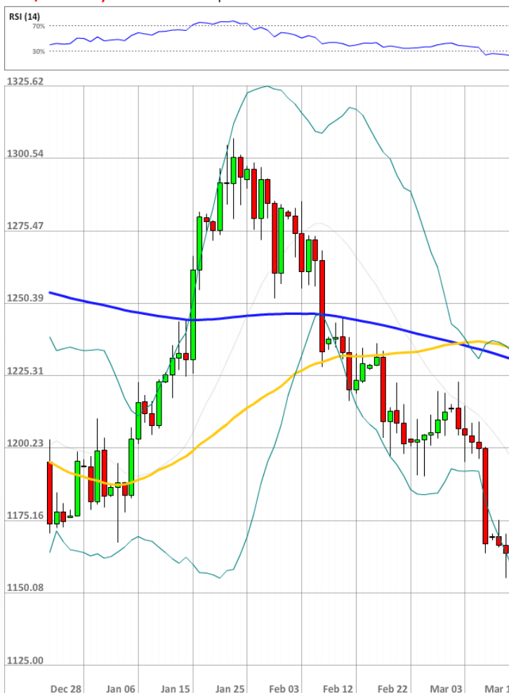
XAU/USD Daily Chart Current price: 1154.04

Настроение по отношению к драгоценному металлу среди трейдеров SWFX является оптимистичным, так как доля быков (68%, без изменений по сравнению со вчерашним днём) превышает долю медведей.