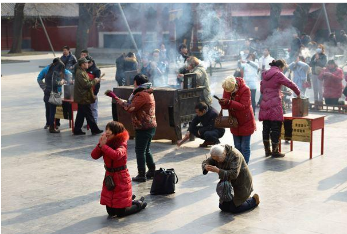
Новый Год закончился, и золото в Китае снова пользуется спросом.

Устойчивость такой поддержки была подвержена испытанию уже в четверг, когда доллар возобновил рост и достиг максимального за один месяц уровня в паре с евро. Подъем на рынке доллара был спровоцирован американской статистикой, свидетельствовавшей об увеличении базовой инфляции потребительских цен.