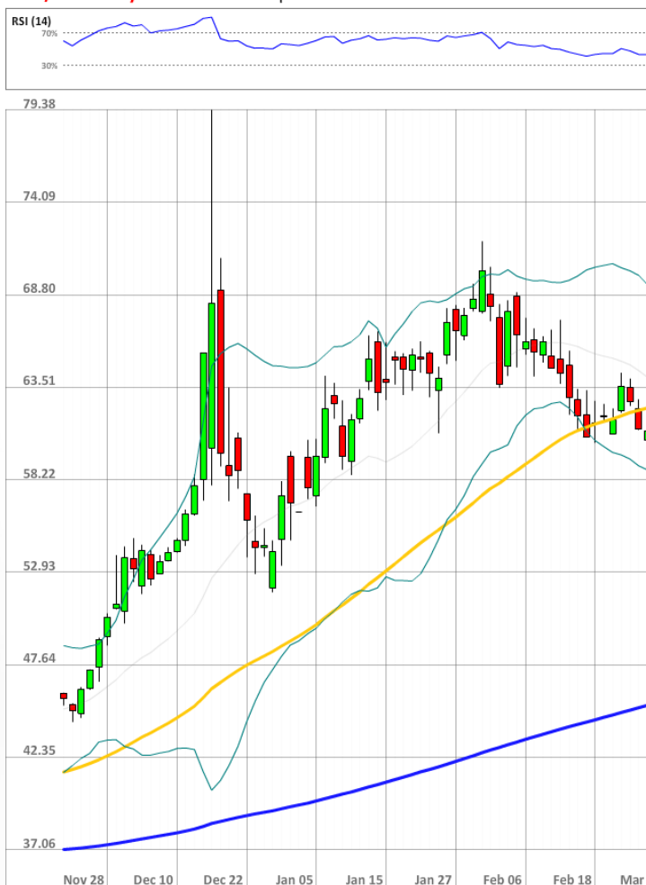
USD/RUB Daily Chart Current price: 62.19

Быки сохраняют значительное численное превосходство над медведями, занимая 73% от всего рынка SWFX, что на 2 п.п. меньше значения в понедельник утром.