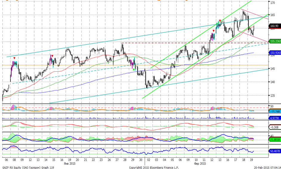
График 4. Часовая динамика стоимости акций Газпрома на ММВБ.

Газпром – встретил сопротивление и направился вниз.