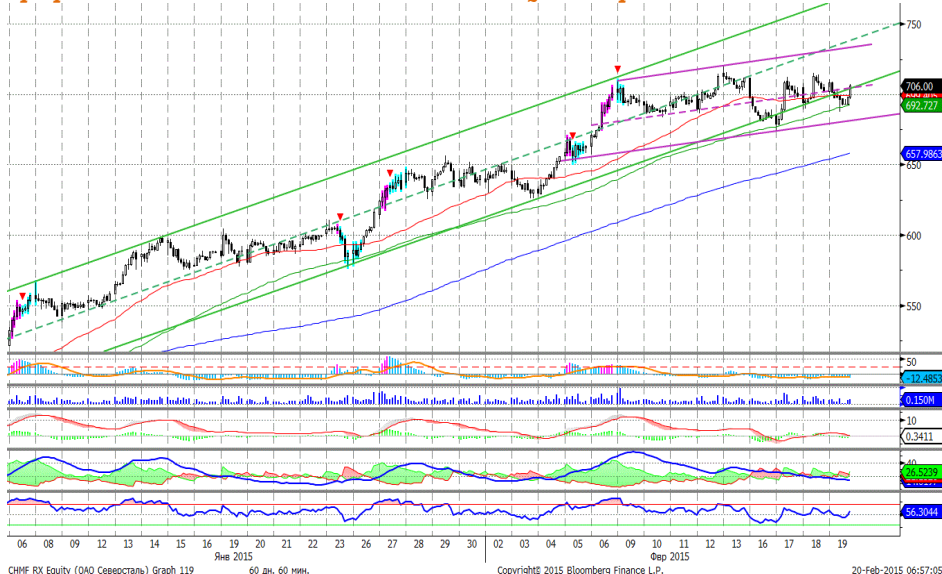
График 5. Часовая динамика стоимости акций Северстали на ММВБ.

Северсталь – замедлила темпы роста, но по-прежнему находится в рамках восходящего тренда.