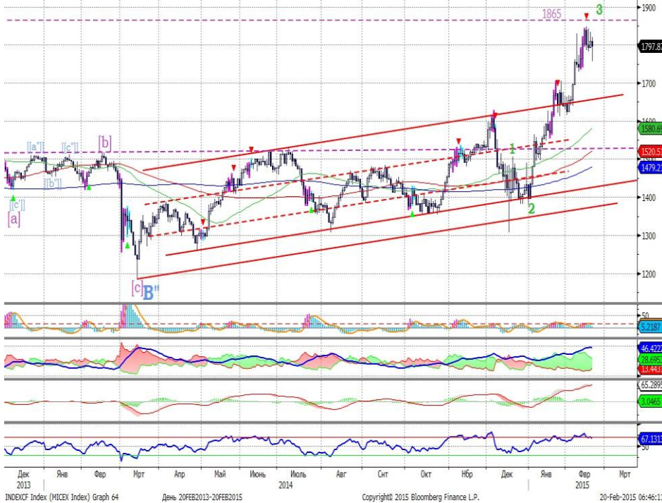
График 1. Дневная динамика Индекса ММВБ.