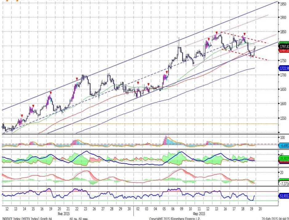
График 2. Часовая динамика Индекса ММВБ.

Индекс ММВБ – находится у нижней границы восходящего коридора значений.