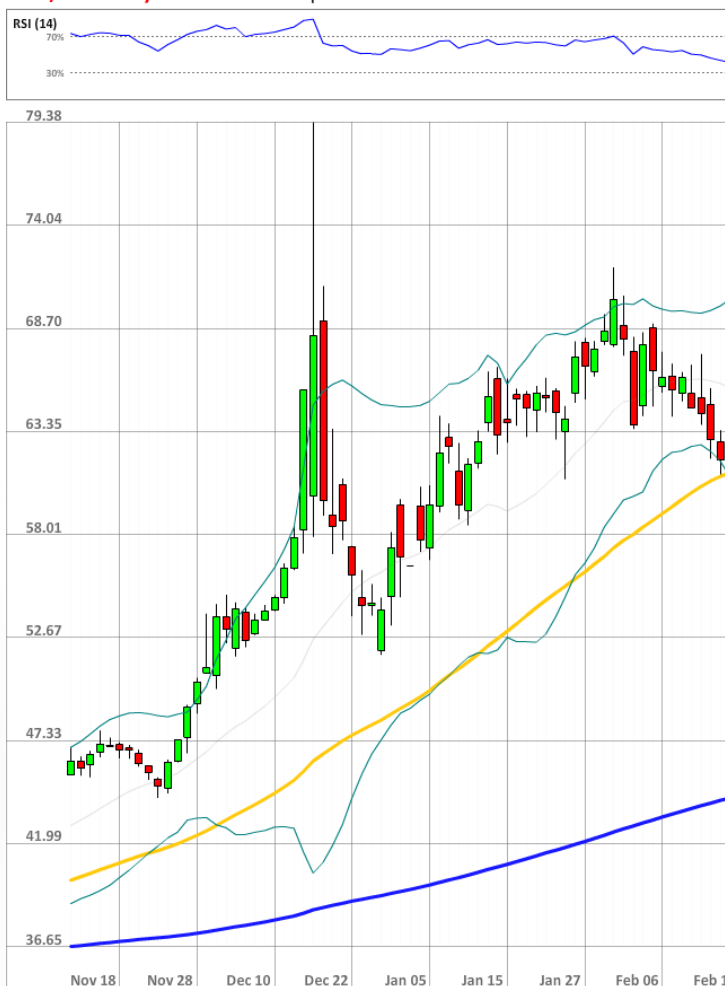
USD/RUB Daily Chart Current price: 61.45

Количество длинных позиций на рынке SWFX остается стабильным, тогда как быки до сих пор занимают большинство рынка по паре USD/RUB, а именно 71% на утро четверга.