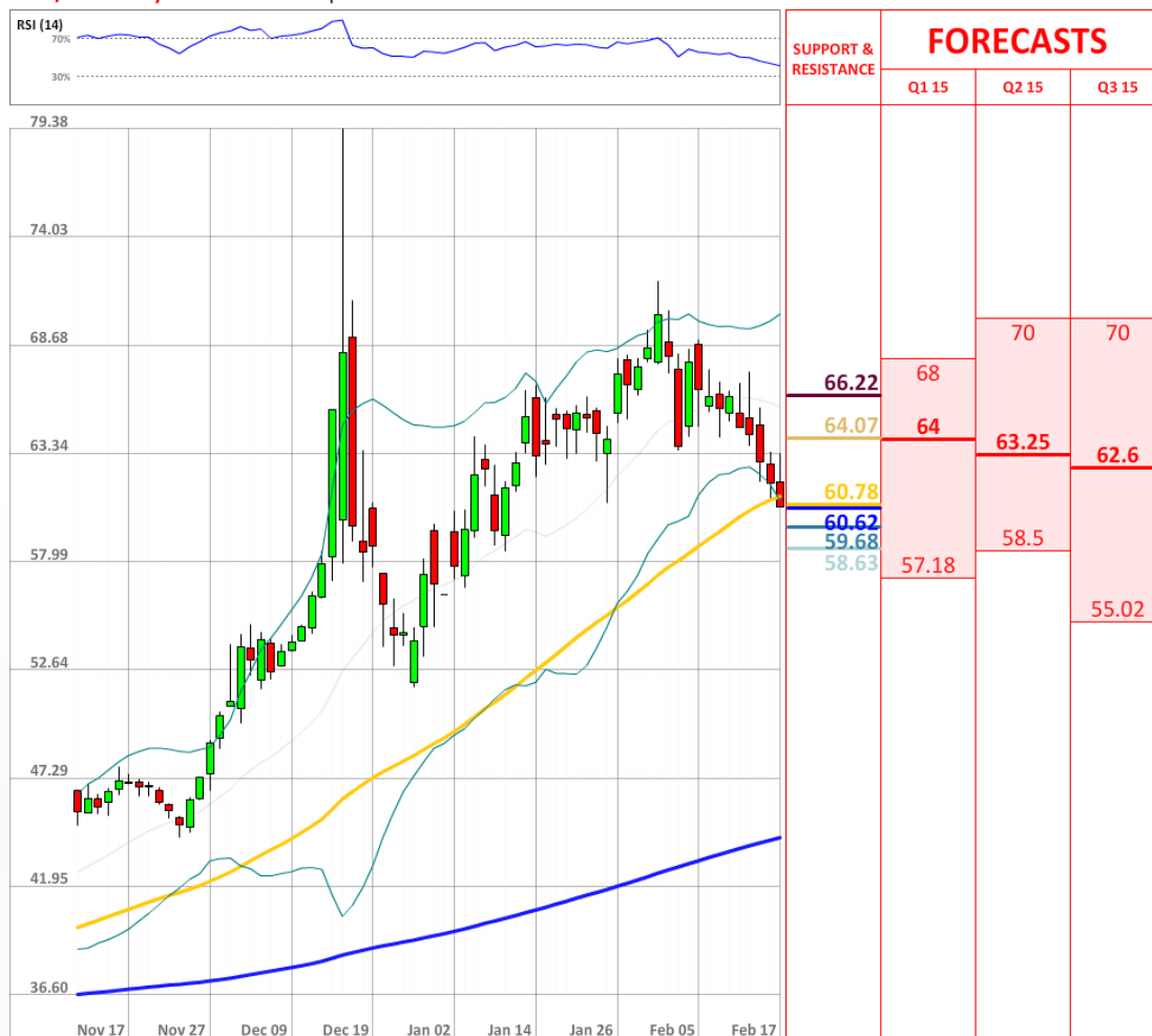
USD/RUB Daily Chart Current price: 60.69

Количество длинных позиций на рынке SWFX остается стабильным, тогда как быки до сих пор занимают большинство рынка по паре USD/RUB, а именно 72% на утро среды.