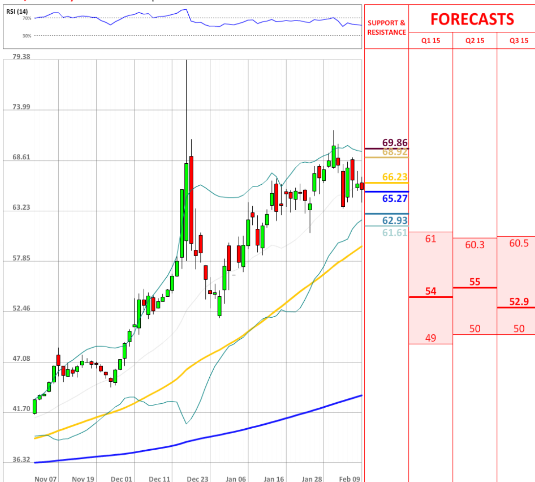
USD/RUB Daily Chart Current price: 65.53

Количество длинных позиций на рынке SWFX остается стабильным, тогда как быки до сих пор занимают большинство рынка по паре USD/RUB, а именно 70% на утро вторника.