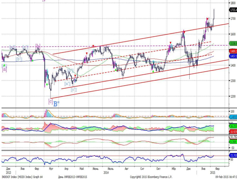
График 1. Дневная динамика Индекса ММВБ.