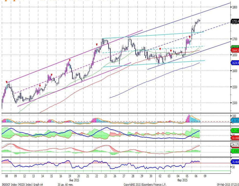
График 2. Часовая динамика Индекса ММВБ.

Индекс ММВБ – продолжает движение вверх.