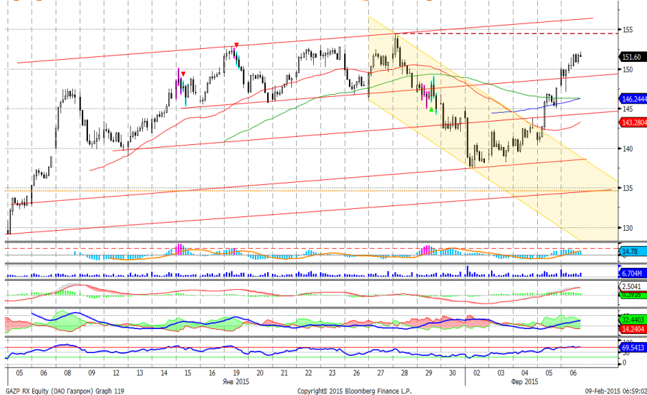
График 4. Часовая динамика стоимости акций Газпрома на ММВБ.