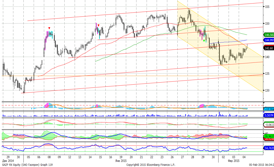
График 4. Часовая динамика стоимости акций Газпрома на ММВБ.

Газпром – котировки стабилизировались. MACD обрабатывает сигнал вверх. ADX указывает на прекращение нисходящего локального тренда. Осциллятор RSI находится в средней части шкалы, сигналов нет. Индикатор, основанный на динамике ADX, в настоящее время выглядит нейтрально. Поддержка: 134,50. Сопротивление: 143,50. Рекомендация: Вне рынка.