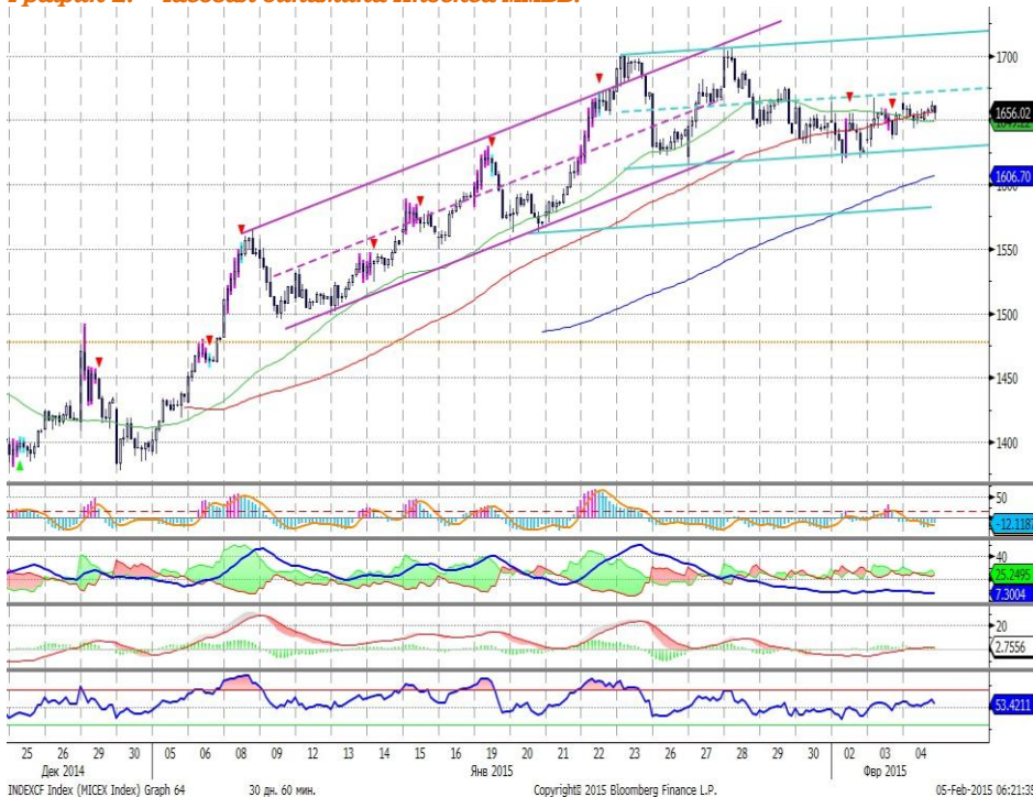
График 2. Часовая динамика Индекса ММВБ.

Индекс ММВБ – в рамках слабовосходящего канала.