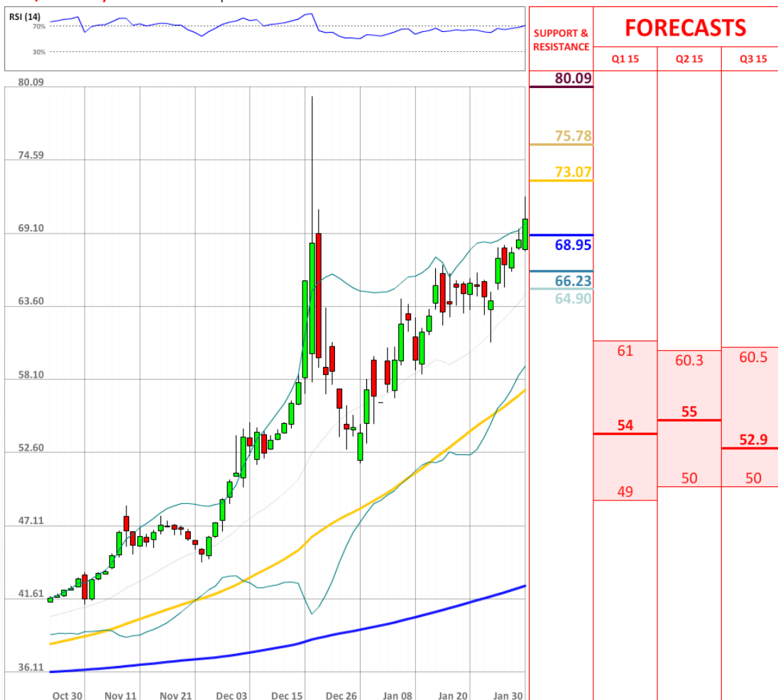
USD/RUB Daily Chart Current price: 70.18

Настроение рынка SWFX остается в большей степени, неизменным, тогда как сейчас быки занимают 72% всего рынка, что на один процентный пункт меньше уровня утра пятницы.