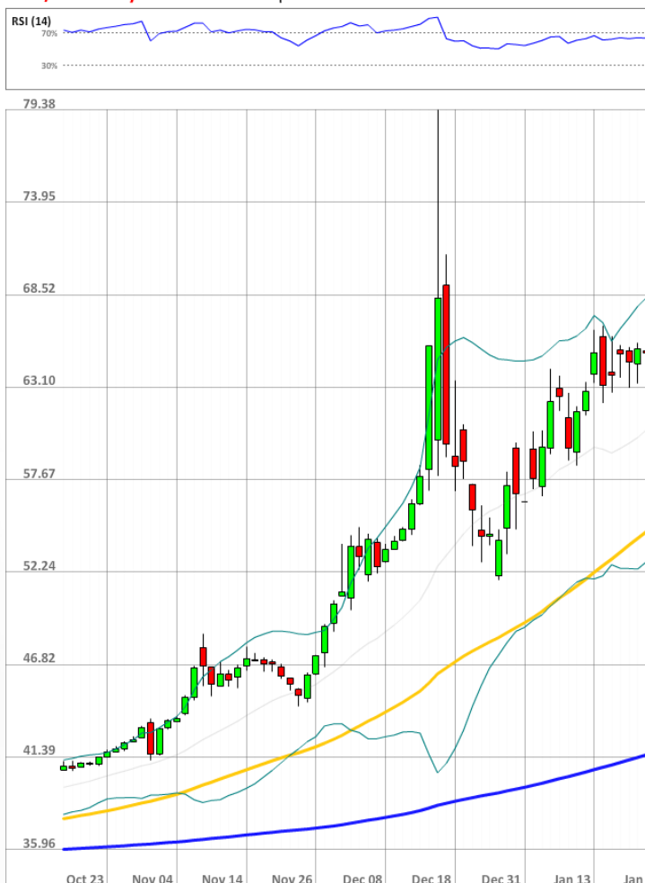
USD/RUB Daily Chart Current price: 64.01

Настроение участников рынка SWFX по паре USD/RUB улучшилось еще сильнее, и на данный момент 74% из них ждут роста доллара США против российской валюты.