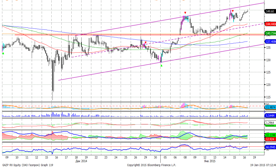
График 4. Часовая динамика стоимости акций Газпрома на ММВБ.

Газпром – приблизилась к верхней границе восходящего ценового коридора, где может встретить сопротивление.