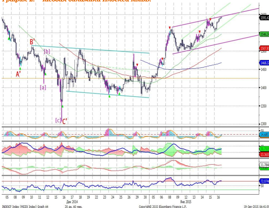
График 2. Часовая динамика Индекса ММВБ.

Индекс ММВБ – у верхней границы умеренно восходящего канала, где может встретить сопротивление и скорректироваться вниз.