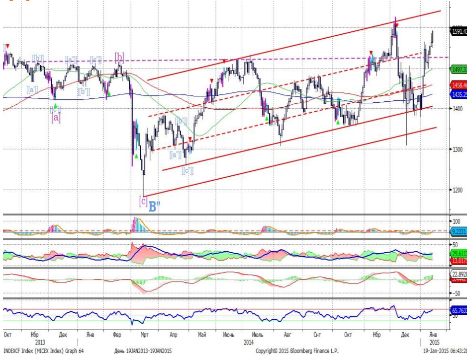
График 1. Дневная динамика Индекса ММВБ.

ДХУ: доллар сохраняет потенциал укрепления