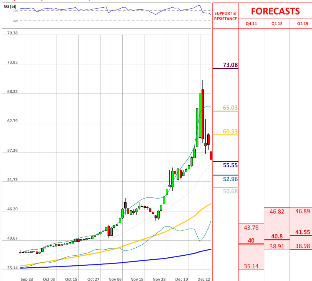
USD/RUB Daily Chart Current price: 55.91

Количество длинных позиций по доллару США против российского рубля составляет 73%. Таким образом, большинство трейдеров остаются бычьими по данной валютной паре.