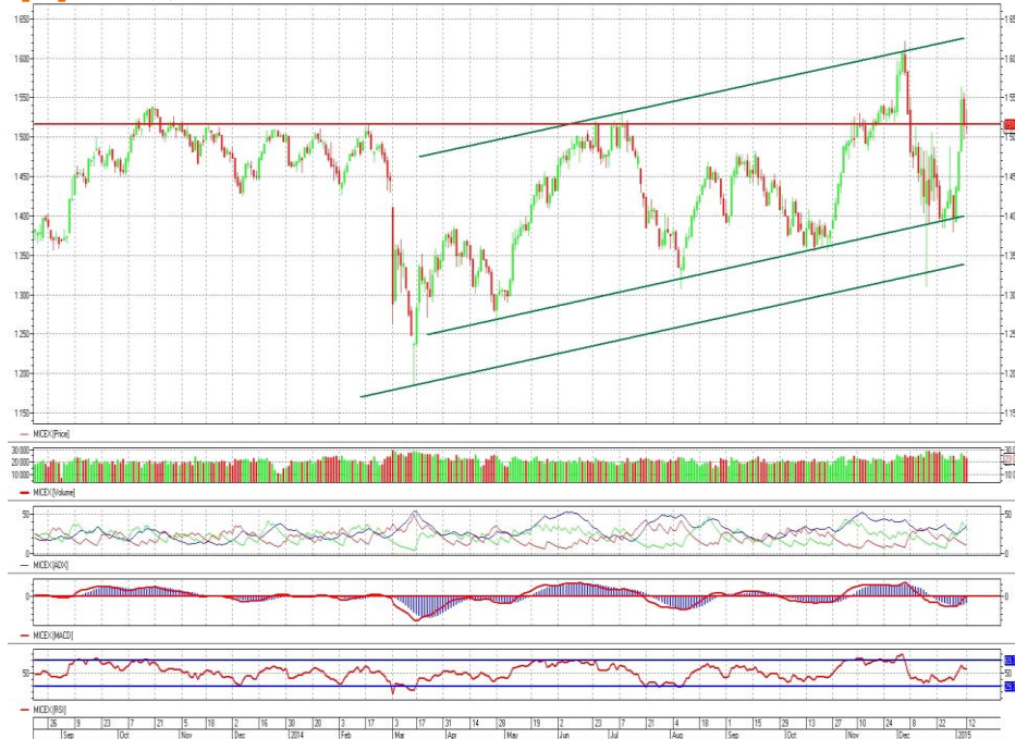
График 1. Дневная динамика Индекса ММВБ.

ДХУ: доллар сохраняет потенциал укрепления