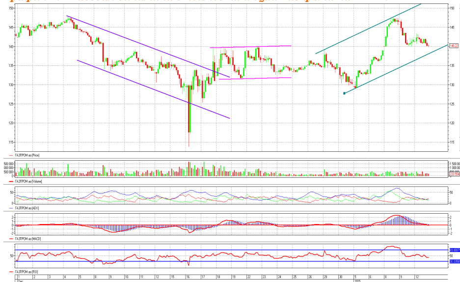
График 4. Часовая динамика стоимости акций Газпрома на ММВБ.

Газпром – котировки движутся в восходящем ценовом коридоре.