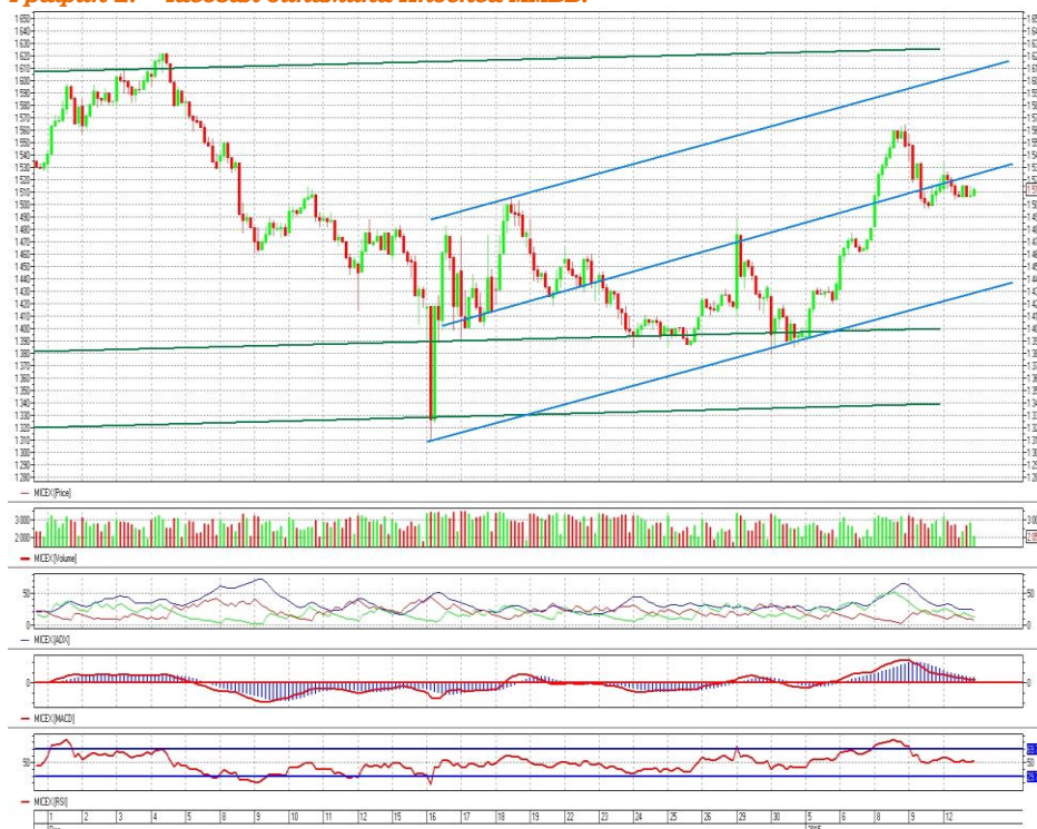
График 2. Часовая динамика Индекса ММВБ.

Индекс ММВБ – находится в восходящем коридоре значений.