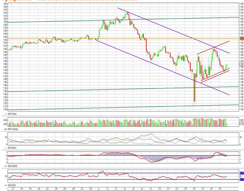
График 2. Часовая динамика Индекса ММВБ.

MACD находится в процессе формирования сигнала вверх. ADX указывает на замедление нисходящего тренда, DMI+ ниже DMI- (индикаторы сходятся), ADX в средней части шкалы и разворачивается вниз. Осциллятор RSI коснулся области перепроданности, неуверенный сигнал вверх.