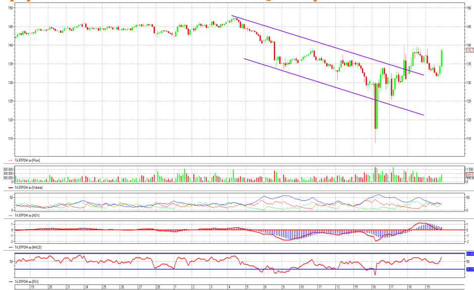
График 4. Часовая динамика стоимости акций Газпрома на ММВБ.

Газпром – котировки вышли вверх из нисходящего ценового коридора.