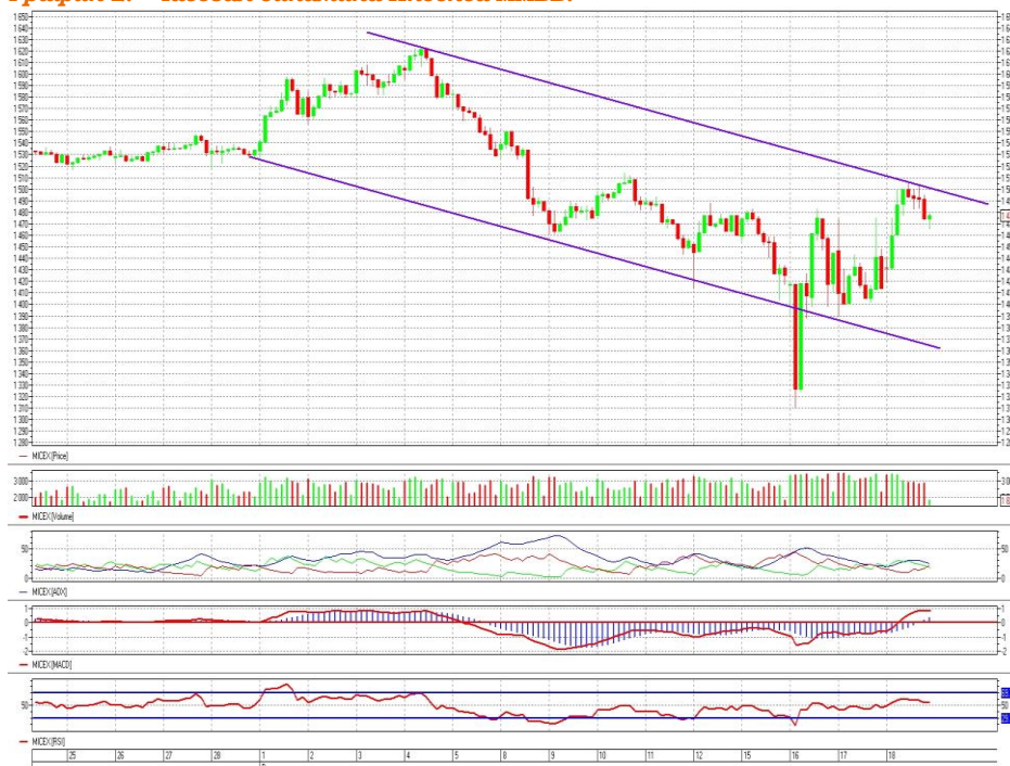
График 2. Часовая динамика Индекса ММВБ.

Индекс ММВБ – остается в пределах нисходящего коридора значений.