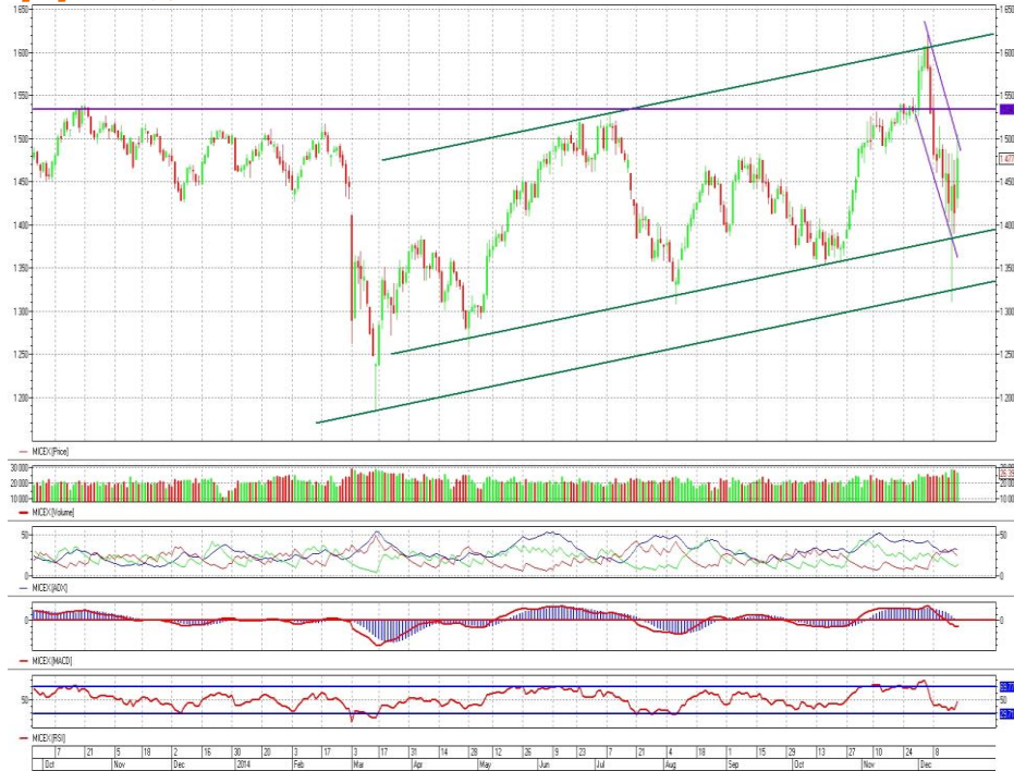
График 1. Дневная динамика Индекса ММВБ.

Индекс ММВБ – достиг поддержки внутри восходящего канала.