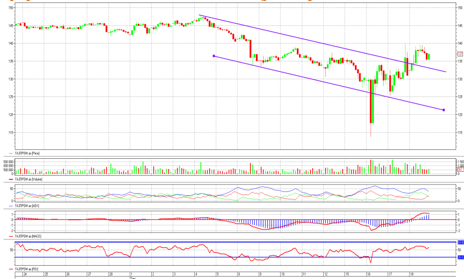
График 4. Часовая динамика стоимости акций Газпрома на ММВБ.

Газпром – котировки вышли вверх из нисходящего ценового коридора.