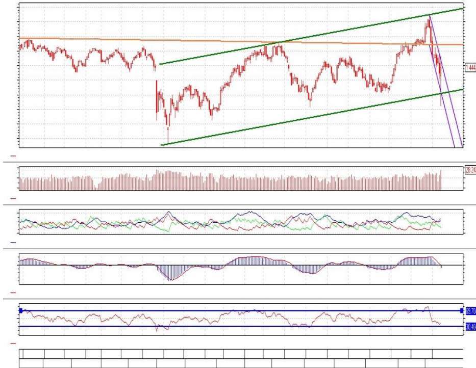
График 1. Дневная динамика Индекса ММВБ.

Индекс ММВБ – достиг поддержки внутри восходящего канала.