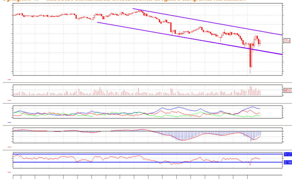
График 4. Часовая динамика стоимости акций Газпрома на ММВБ.

Газпром – котировки в рамках нисходящего ценового коридора.