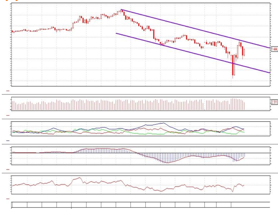
График 2. Часовая динамика Индекса ММВБ.

Индекс ММВБ – в пределах нисходящего коридора значений.