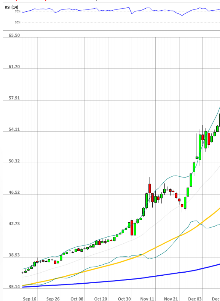
USD/RUB Daily Chart Current price: 65.50

Российская валюта в понедельник показала самое сильное падение со времен дефолта 1998 года. Курс к доллару рухнул на шесть рублей до отметки 65. В результате ЦБ РФ принял решение повысить ключевую процентную ставку с 10.5% до 17%, которая действительна уже со вторника. По прогнозам аналитиков, рост американской валюты по отношению к рублю могут остановить только активные интервенции со стороны Центрального банка, чтобы по максимуму уменьшить предложение рубля на рынке и, таким образом, повысить его стоимость. Тем не менее, некоторые инвесторы рассуждают, что краткосрочные вбрасывания валюты на рынок, которые повышают курс российской валюты, в долгосрочной перспективе не дают желанного эффекта, так как краткосрочные коррекции только подталкивают участников рынка на еще большие продажи рубля. Падение российской валюты мог бы остановить рост цен на нефть, но это в среднесрочной перспективе также кажется маловероятным.