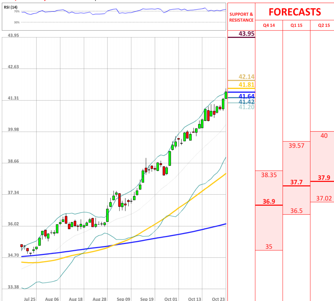
USD/RUB Daily Chart Current price: 41.67

Очень незначительные изменения произошли в настроении рынка за последние 24 часа. На данный момент 69% трейдеров держат длинные позиции по паре USD/RUB, немного ниже вчерашних 70%.