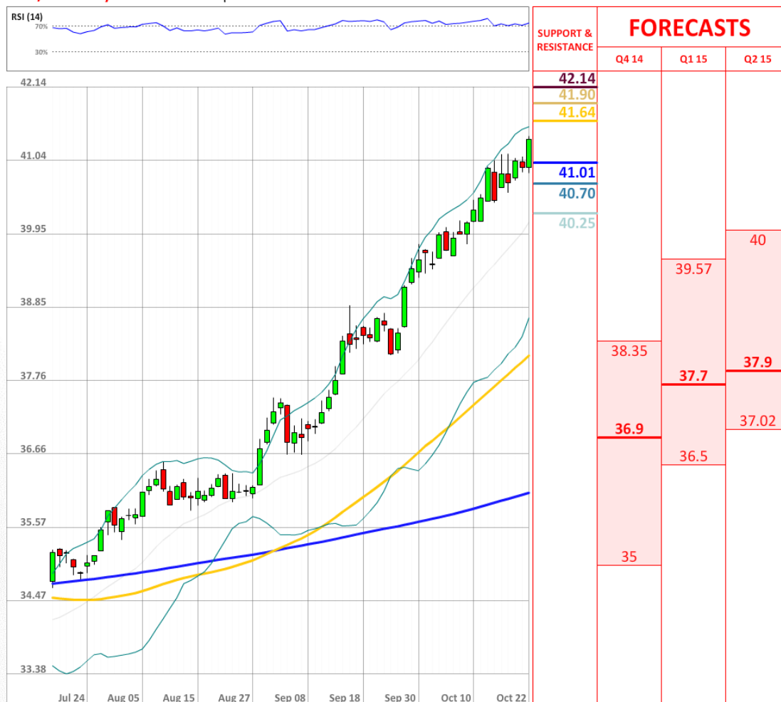
USD/RUB Daily Chart Current price: 41.36

Настроения по данной валютной паре снова пошли вверх, так как сейчас уже 70% трейдеров ждут подорожания доллара США, хотя еще вчера таковых насчитывалось 60%.