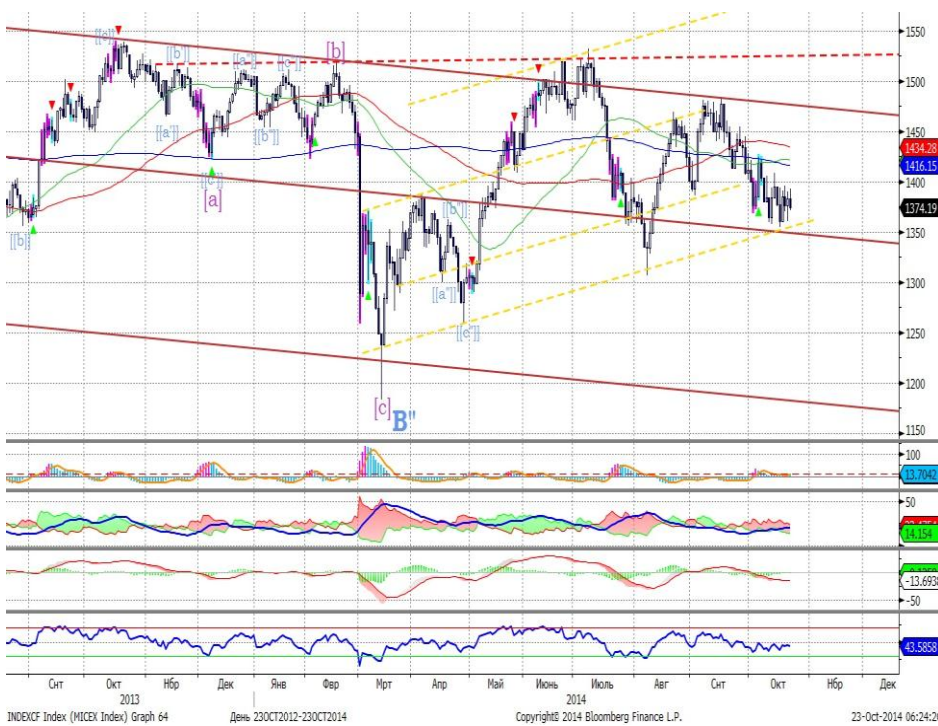
График 1. Дневная динамика Индекса ММВБ.