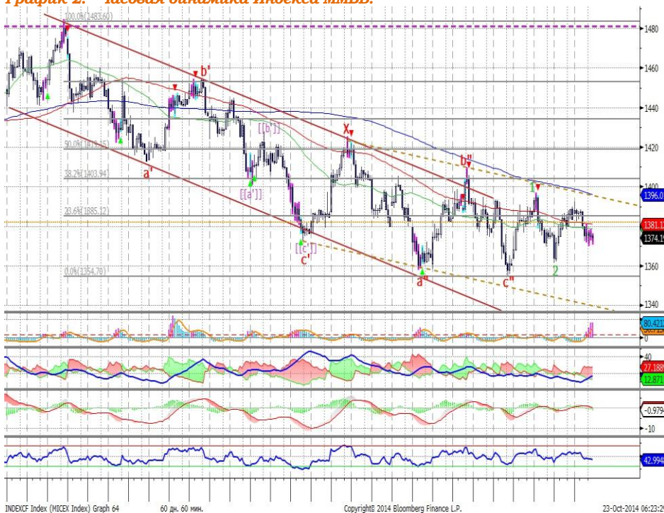
График 2. Часовая динамика Индекса ММВБ.

Индекс ММВБ – в границах нисходящего канала.