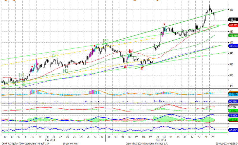
График 5. Часовая динамика стоимости акций Северстали на ММВБ.

Северсталь – наметилась коррекция роста.