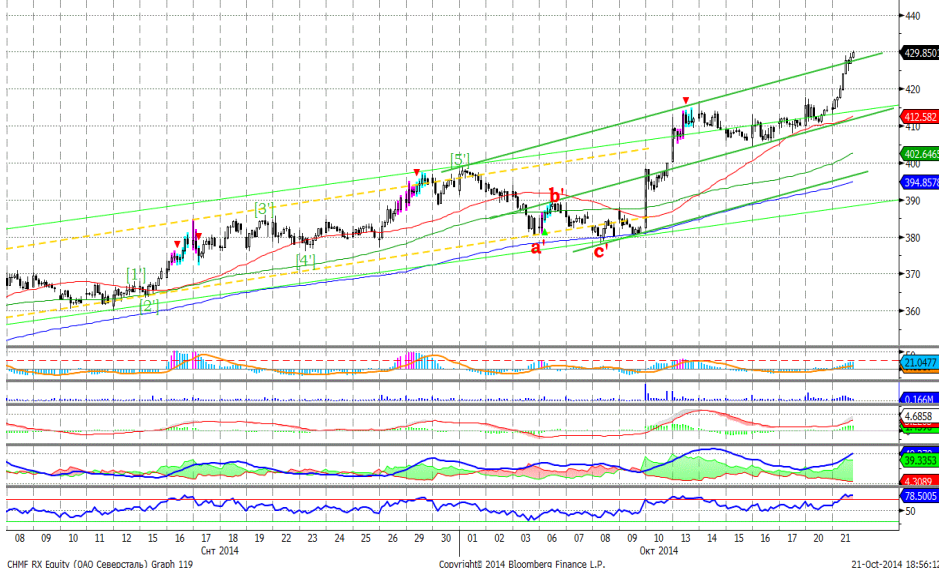
График 5. Часовая динамика стоимости акций Северстали на ММВБ.