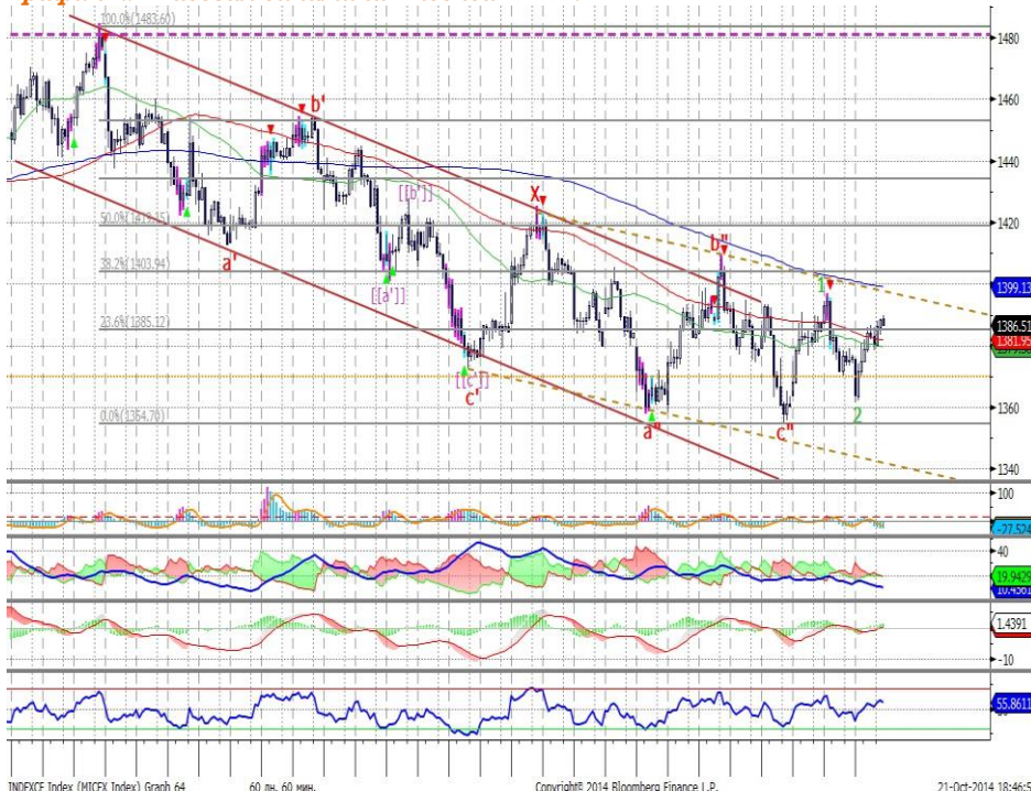
График 2. Часовая динамика Индекса ММВБ.

Индекс ММВБ – движется вверх в границах нисходящего канала.