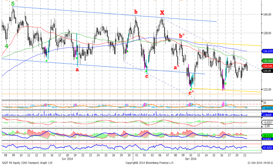
График 4. Часовая динамика стоимости акций Газпрома на ММВБ.

Газпром – приблизился к верхней границе нисходящего ценового коридора, возможно продолжение роста.