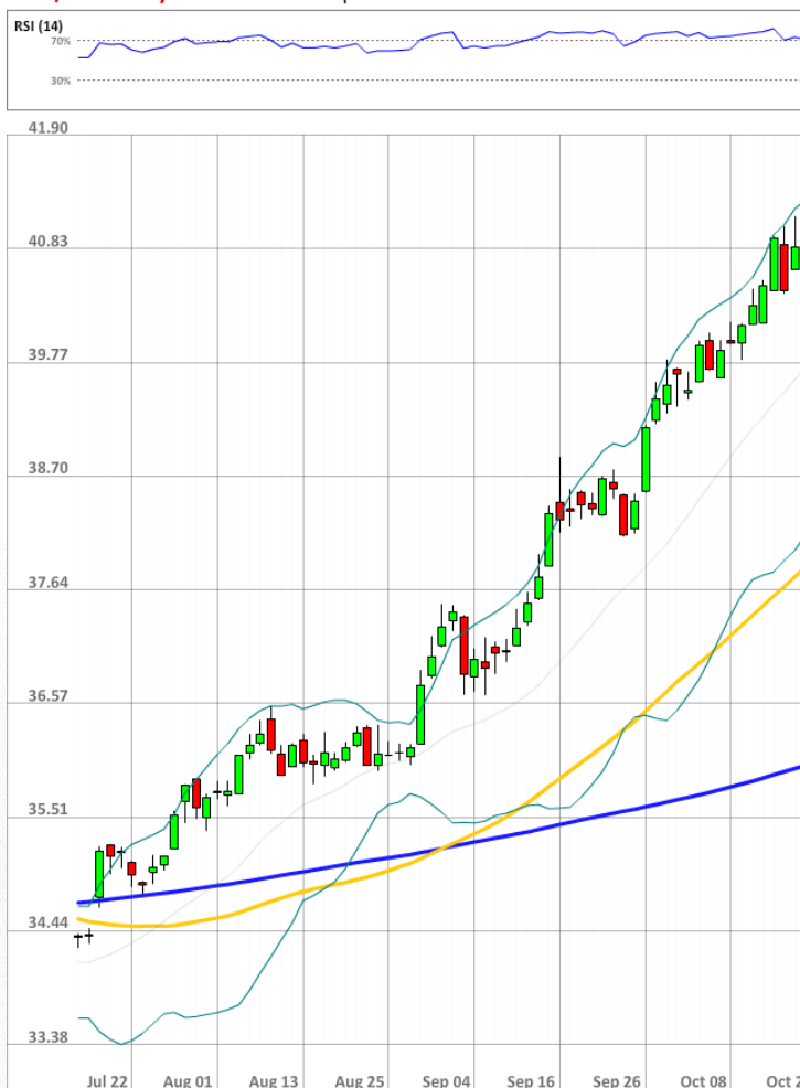
USD/RUB Daily Chart Current price: 41.04

Только незначительные изменения произошли в настроении рынка за последние 24 часа. Если вчера длинные позиции удерживались 63% всех трейдеров, то сейчас роста доллара США ожидают 62% из них.