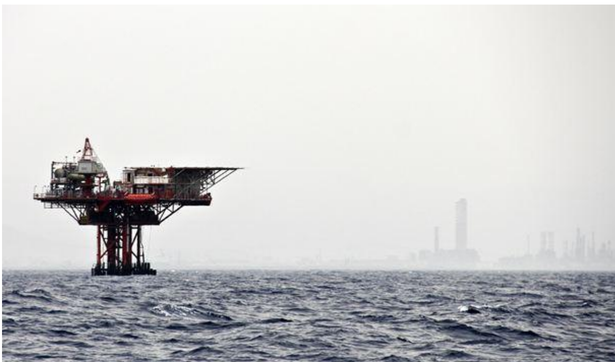
В условиях роста нефтедобычи и низкого спроса цены на нефть остаются под давлением.

По действию этого фактора, а также неутешительных перспектив спроса в Европе и Китае цена на нефть сорта Brent продолжила снижаться более сильными темпами, чем нефть сорта WTI. В результате спред между фьючерсами с поставкой в ближайшем месяце по этим двум сортам уменьшился до значения менее четырех долларов за баррель, приблизившись к самому низкому за этот год уровню.