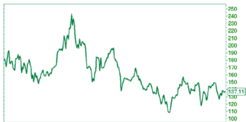
— ГАЗПРОМ ао [Price] [2009|2010|May|Sep|2011|May|Sep|2012|May|Sep|2013|May|Sep|2014|May|Sep] 52w Lo — Hi 114 — 158