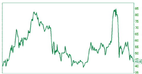
— Аэрофлот [Price] [2009|2010|May|Sep|2011|May|Sep|2012|May|Sep|2013|May|Sep|2014|May|Sep] 52w Lo — Hi 41 — 88