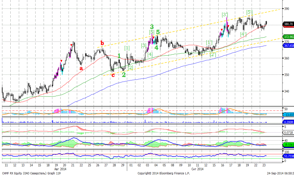
График 5. Часовая динамика стоимости акций Северстали на ММВБ.

Северсталь – продолжает находиться в пределах умеренно восходящего канала.