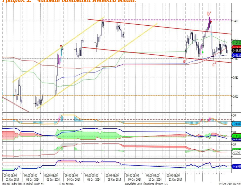
График 2. Часовая динамика Индекса ММВБ.

MACD выглядит нейтрально. ADX указывает на отсутствие тренда, DMI+ и DMI- сошлись, ADX в нижней части шкалы и направлен вниз. Осциллятор RSI находится в средней части шкалы, сигналов нет. Индикатор, основанный на динамике ADX, в настоящее время выглядит нейтрально.