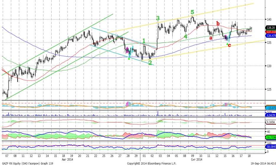
График 4. Часовая динамика стоимости акций Газпрома на ММВБ.

Газпром – находится в восходящем ценовом коридоре.