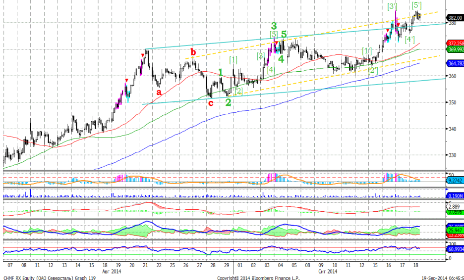
График 5. Часовая динамика стоимости акций Северстали на ММВБ.

Северсталь – достигла уровня сопротивления, возможна коррекция вниз.