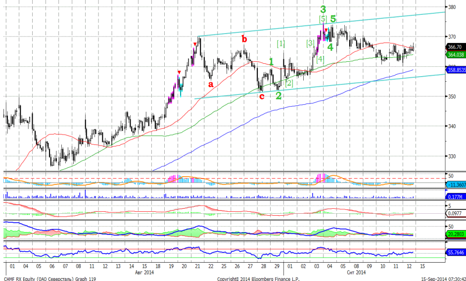
График 5. Часовая динамика стоимости акций Северстали на ММВБ.

Северсталь – котировки относительно стабильны.