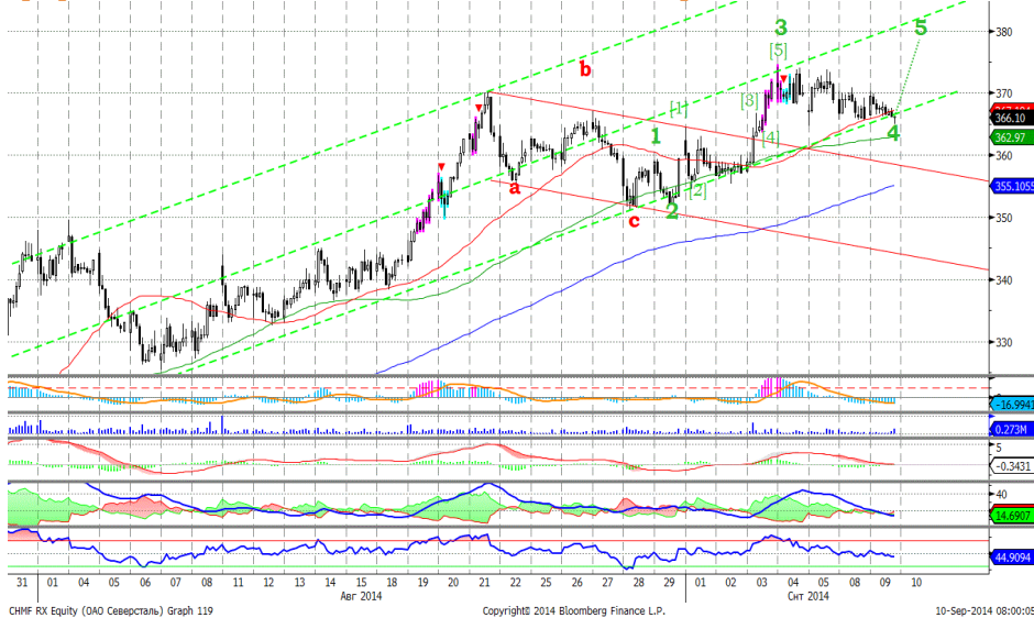
График 5. Часовая динамика стоимости акций Северстали на ММВБ.

Северсталь – ожидаем возобновление роста.