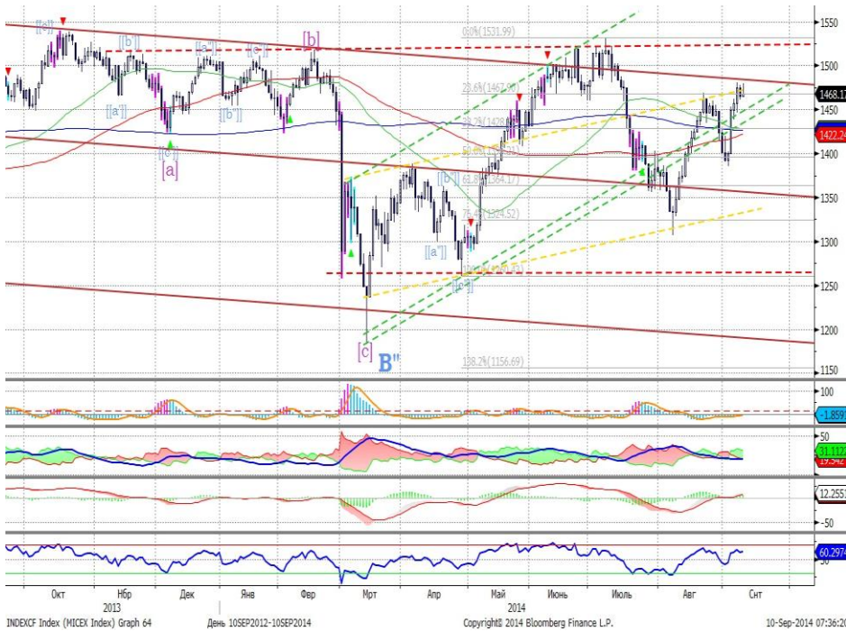
График 1. Дневная динамика Индекса ММВБ.

Дефицит палладия толкает котировки вверх