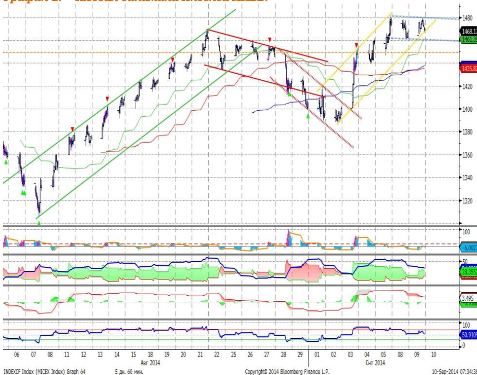
График 2. Часовая динамика Индекса ММВБ.

Индекс ММВБ – демонстрирует нейтральную динамику.