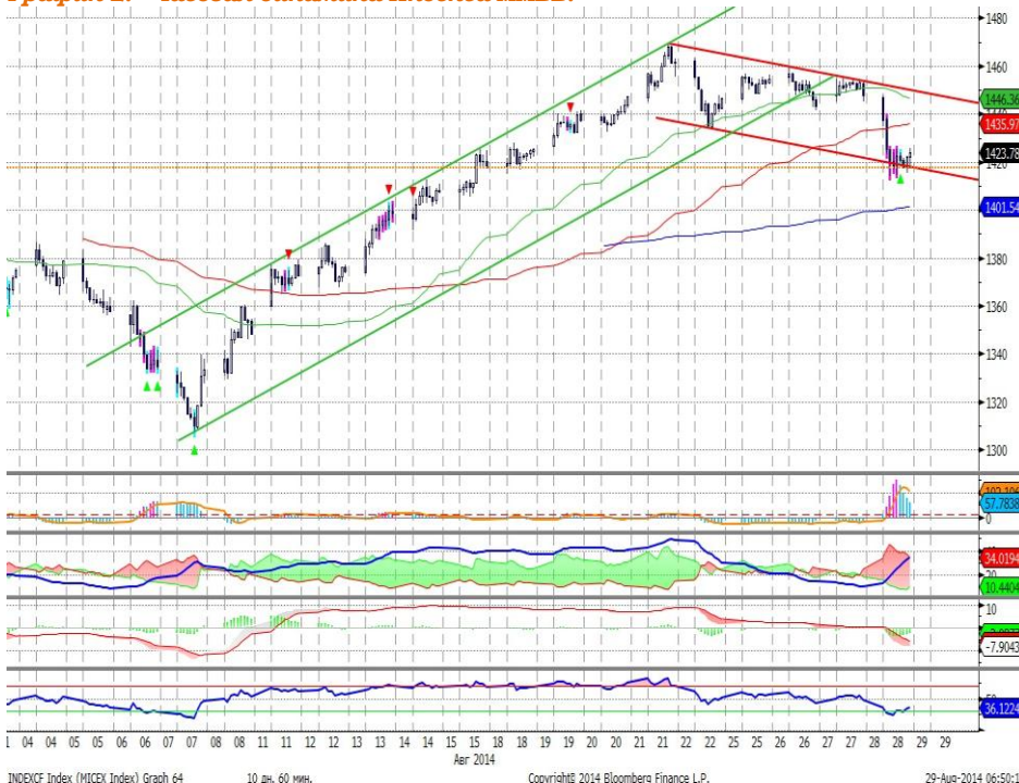
График 2. Часовая динамика Индекса ММВБ.

Индекс ММВБ – сформирована фаза коррекционного снижения, возможно движение значения индекса вверх.