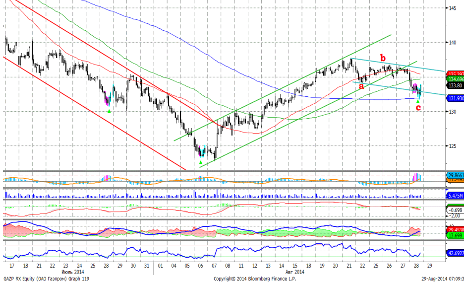
График 4. Часовая динамика стоимости акций Газпрома на ММВБ.

Газпром – сформировал фазу коррекции роста.