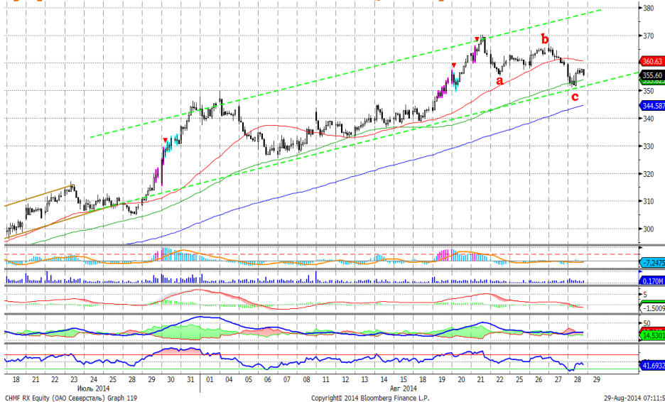
График 5. Часовая динамика стоимости акций Северстали на ММВБ.

Северсталь – пришла к нижней границе ценового коридора, где может получить сильную поддержку.