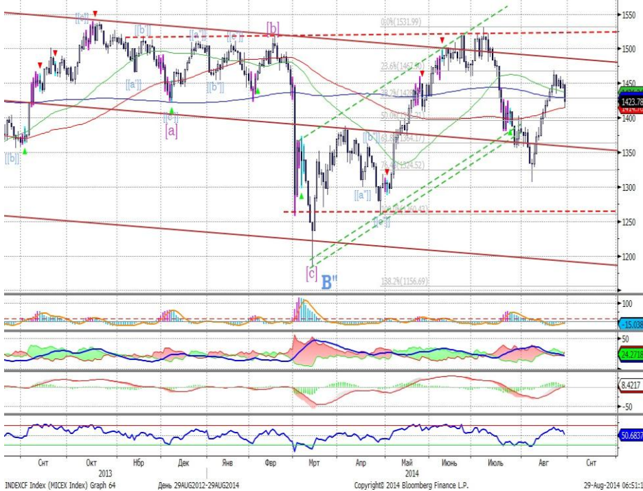
График 1. Дневная динамика Индекса ММВБ.