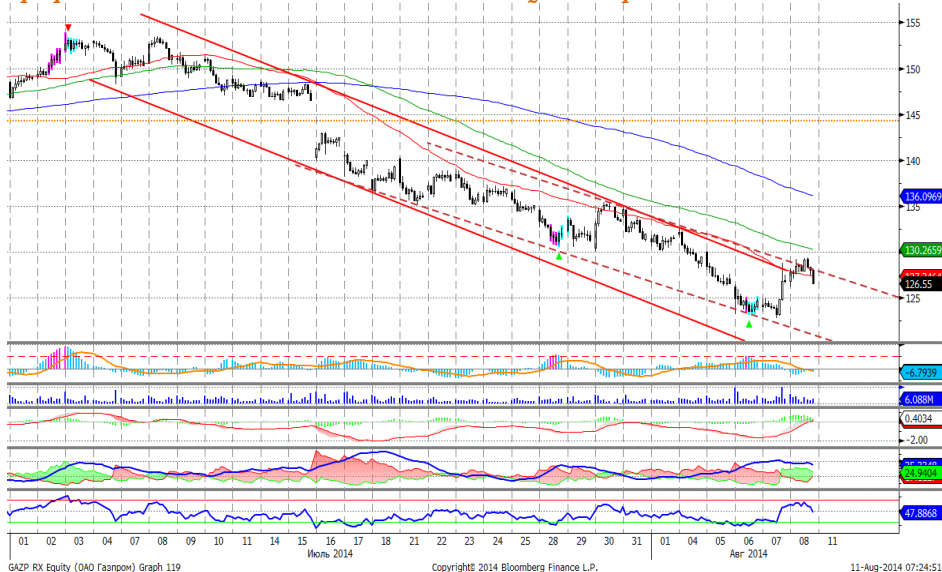
График 4. Часовая динамика стоимости акций Газпрома на ММВБ.