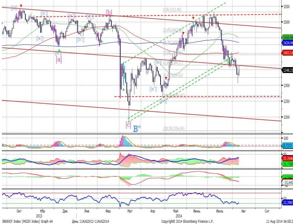
График 1. Дневная динамика Индекса ММВБ.

Индекс ММВБ – сформирована свечная фигура, сигнализирующая о развороте к росту.