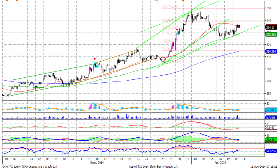
График 5. Часовая динамика стоимости акций Северстали на ММВБ.

Северсталь – котировки стабилизировались и постепенно пошли вверх.