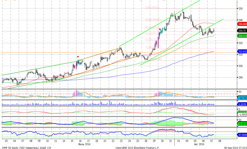
График 5. Часовая динамика стоимости акций Северстали на ММВБ.

Северсталь – корректируется после импульса роста. MACD сформировал сигнал к росту. ADX указывает на прекращение нисходящего локального тренда. Осциллятор RSI побывал в зоне перепроданности, сигнал вверх. Индикатор, основанный на динамике ADX, в настоящее время выглядит нейтрально. Поддержка: 321,0. Сопротивление: 337,0. Рекомендация: Вне рынка.