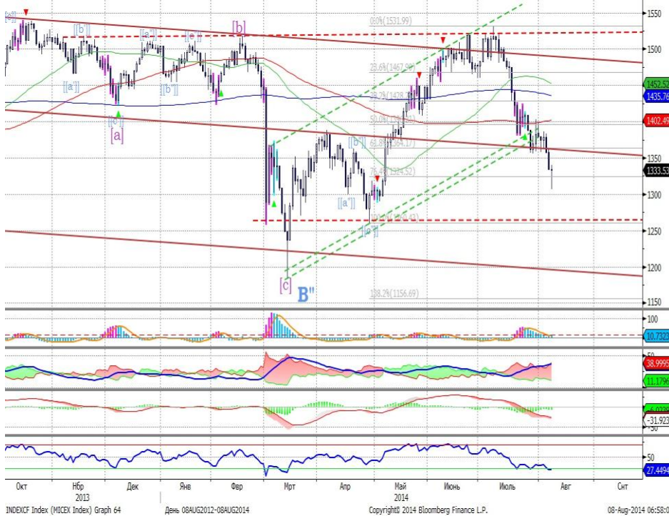
График 1. Дневная динамика Индекса ММВБ.

Индекс ММВБ – в случае завершения сегодняшнего дня в плюсе, будет сформирована свечная фигура, сигнализирующая о развороте к росту.