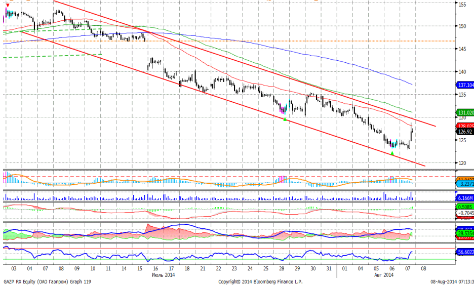
График 4. Часовая динамика стоимости акций Газпрома на ММВБ.

Газпром – в рамках нисходящего канала. MACD сформировал сигнал вверх. ADX указывает на прекращение нисходящего локального тренда. Осциллятор RSI побывал в зоне перепроданности, сигнал вверх. Индикатор, основанный на динамике ADX, 6 августа дал повторный сигнал к росту. Поддержка: 120,00. Сопротивление: 130,00. Рекомендация: Вне рынка.