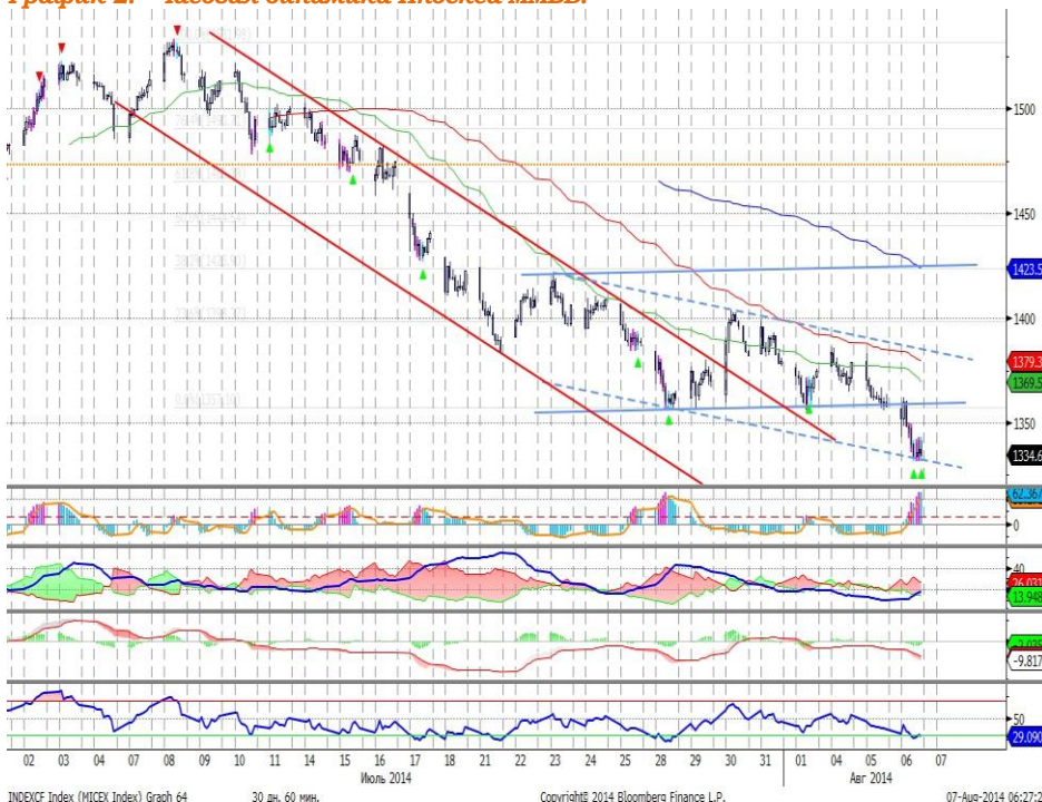
График 2. Часовая динамика Индекса ММВБ.

MACD отрабатывает сигнал вниз. ADX указывает на наличие нисходящего тренда, DMI+ ниже DMI-, ADX в средней части шкалы и направлен вверх. Осциллятор RSI побывал в зоне перепроданности, сигнал вверх. Индикатор, основанный на динамике ADX, 25 июля дал сигнал к покупке.