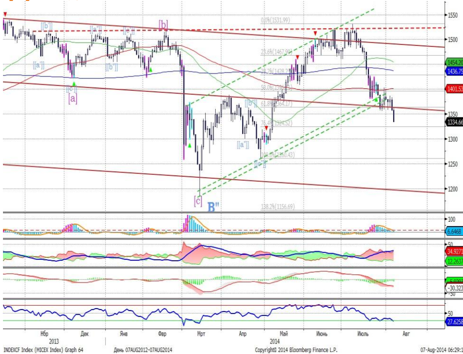
График 1. Дневная динамика Индекса ММВБ.

ММК: восстановление котировок может продолжиться