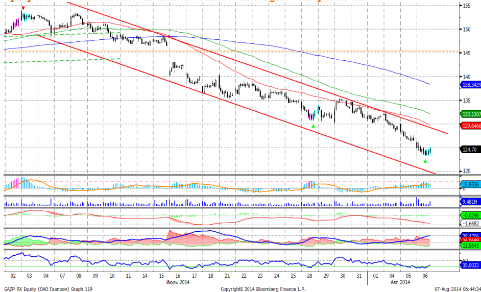
График 4. Часовая динамика стоимости акций Газпрома на ММВБ.