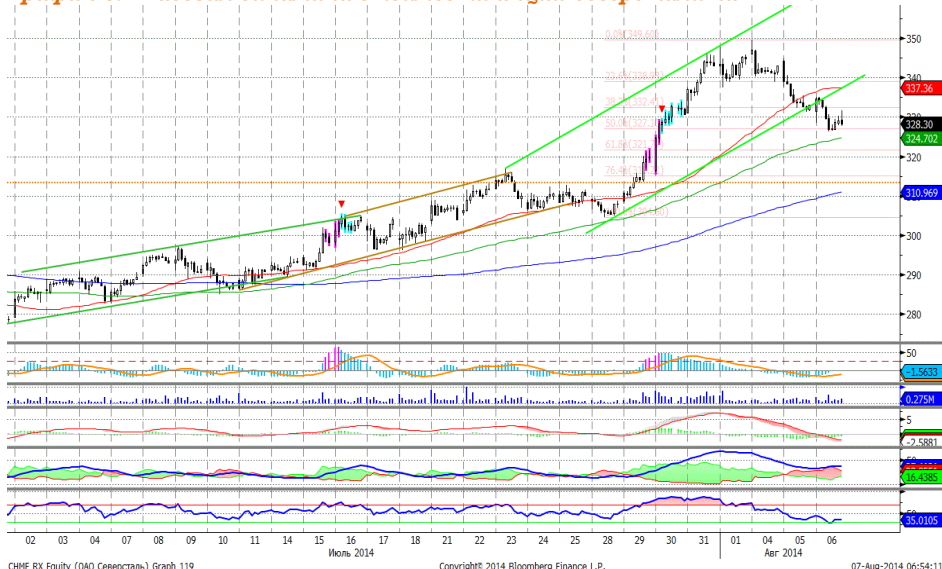
График 5. Часовая динамика стоимости акций Северстали на ММВБ.

Северсталь – корректируется после импульса роста.