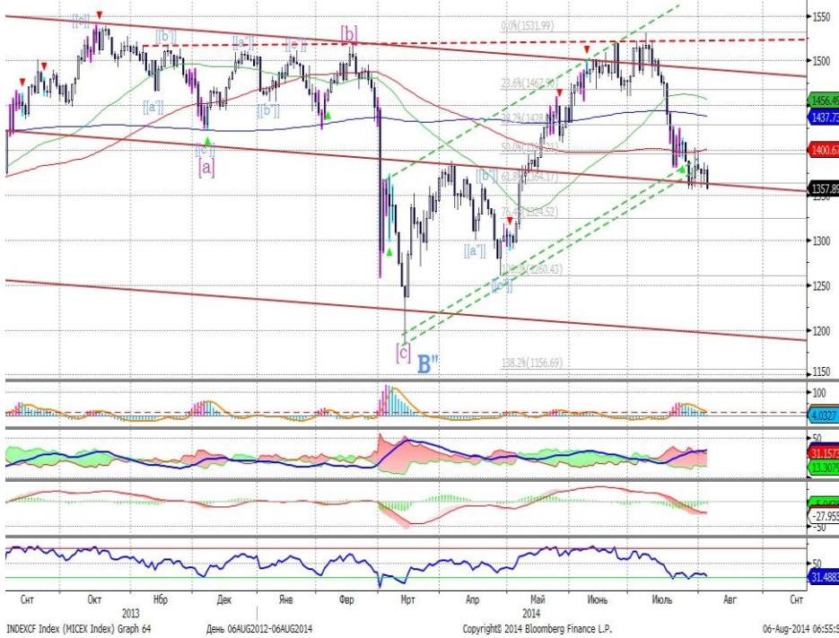
График 1. Дневная динамика Индекса ММВБ.

Индекс ММВБ – консолидировался вблизи нижней границы восходящего канала.