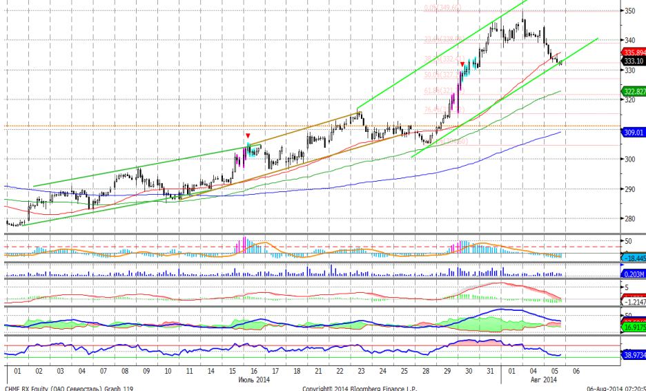
График 5. Часовая динамика стоимости акций Северстали на ММВБ.

Северсталь – корректируется после импульса роста.