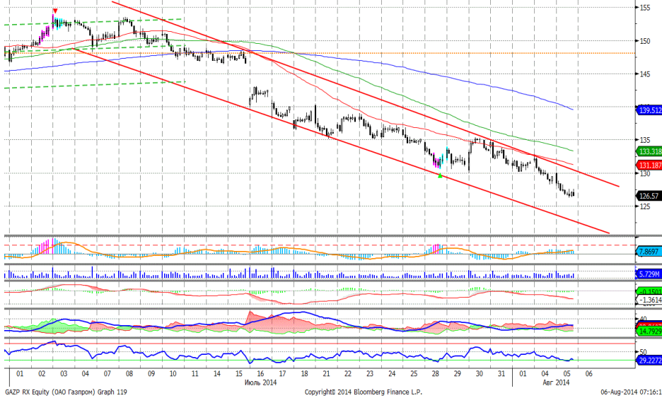
График 4. Часовая динамика стоимости акций Газпрома на ММВБ.