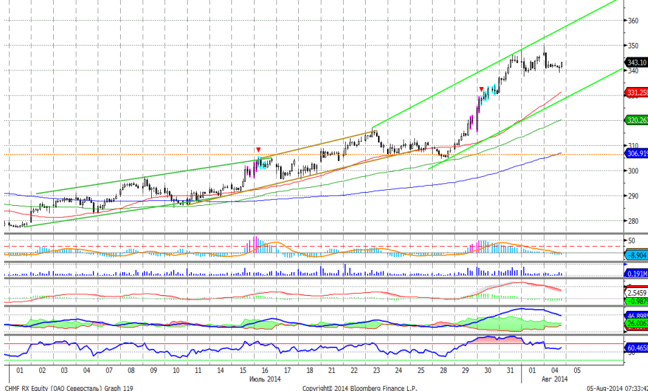
График 5. Часовая динамика стоимости акций Северстали на ММВБ.

Северсталь – консолидируется после импульса роста.