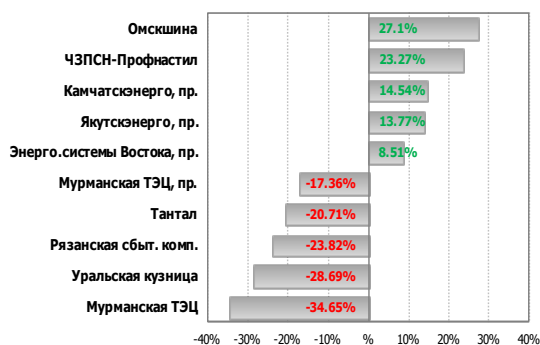
Лидеры и аутсайдеры за день в МІСЕХ