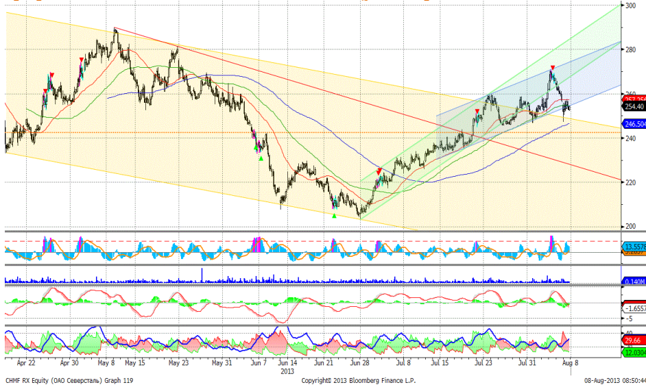
График 5. Часовая динамика стоимости акций Северстали на ММВБ.

Северсталь – формирует восходящий тренд.