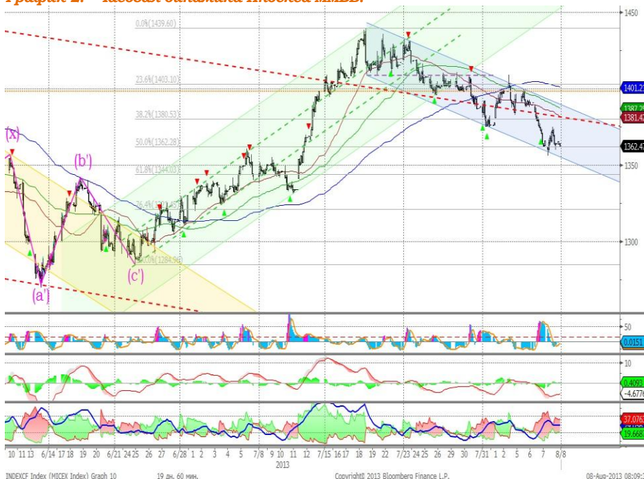
График 2. Часовая динамика Индекса ММВБ.

Индекс ММВБ – преодолел верхнюю границу нисходящего тренда (красная пунктирная линия), которую тестирует в настоящее время в качестве уровня поддержки.