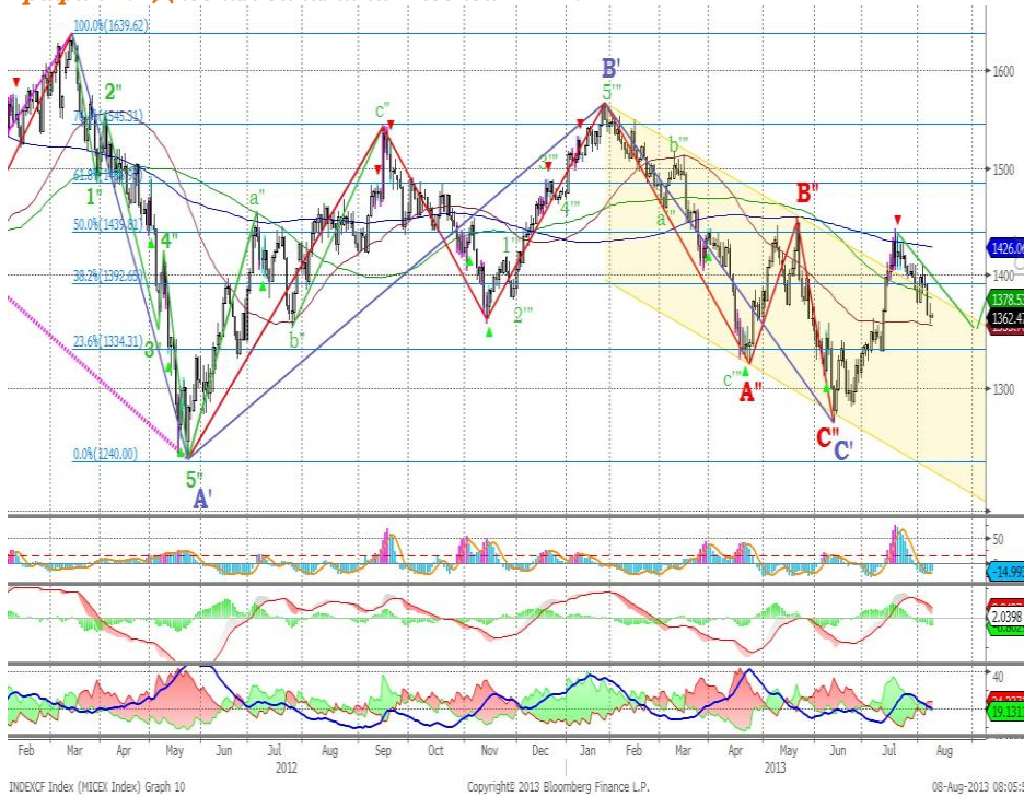
График 1. Дневная динамика Индекса ММВБ.

Индекс ММВБ – преодолел верхнюю границу нисходящего тренда, корректируется.