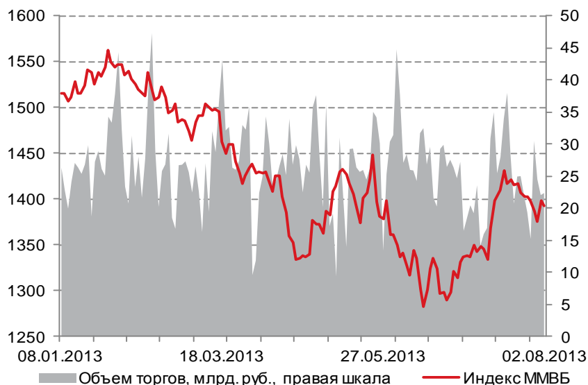
Динамика индекса ММВБ

Важных событий сегодня, в понедельник, ожидается традиционно немного. Поэтому консолидация вблизи текущих уровней выглядит наиболее вероятным сценарием сегодняшних торгов на рынке. Несколько оживить инвесторов могут данные по деловой активности в секторе услуг ведущих европейских стран и США. Кроме того, в Еврозоне выйдут данные по розничным продажам и индексу инвестиционного доверия от Sentix. Из результатов западных компаний, которые сегодня отчитываются за 2-й квартал, отметим лишь данные HSBC Holdings, USEC и Tyson Foods.